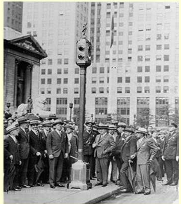
Первый электрический светофор