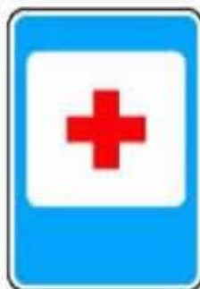
7.1 Пункт первой медицинской помощи