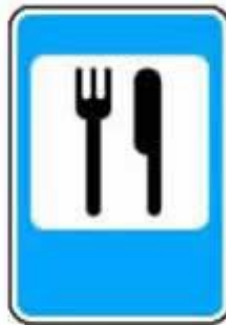
7.7 Пункт питания