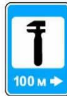
7.4 Техническое обслуживание автомобилей