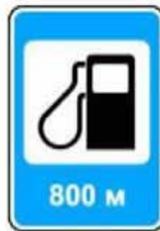
7.3 Автозаправочная станция