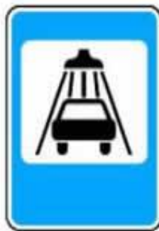
7.5 Мойка автомобилей