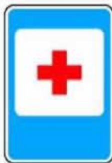
7.1 Пункт первой медицинской помощи