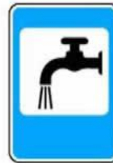
7.8 Питьевая вода