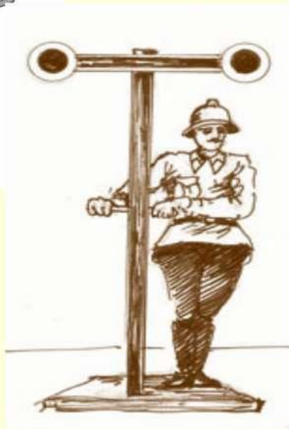
Первый уличный семафор