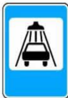
7.5 Мойка автомобилей