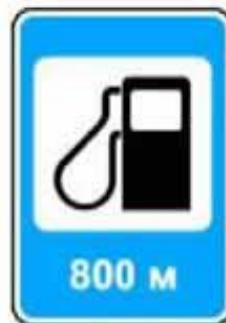
7.3 Автозаправочная станция