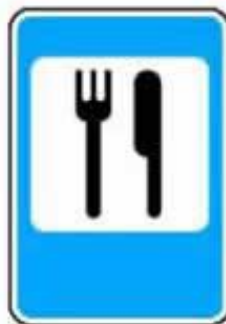
7.7 Пункт питания