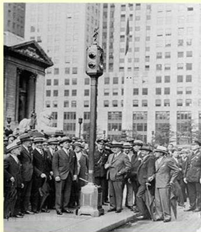
Первый электрический светофор