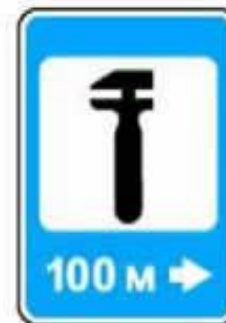
7.4 Техническое обслуживание автомобилей