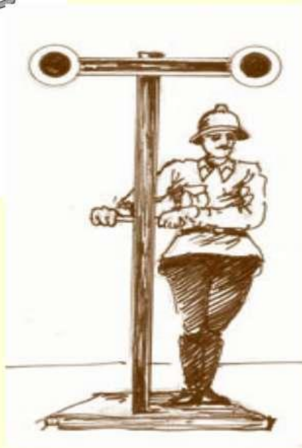
Первый уличный семафор