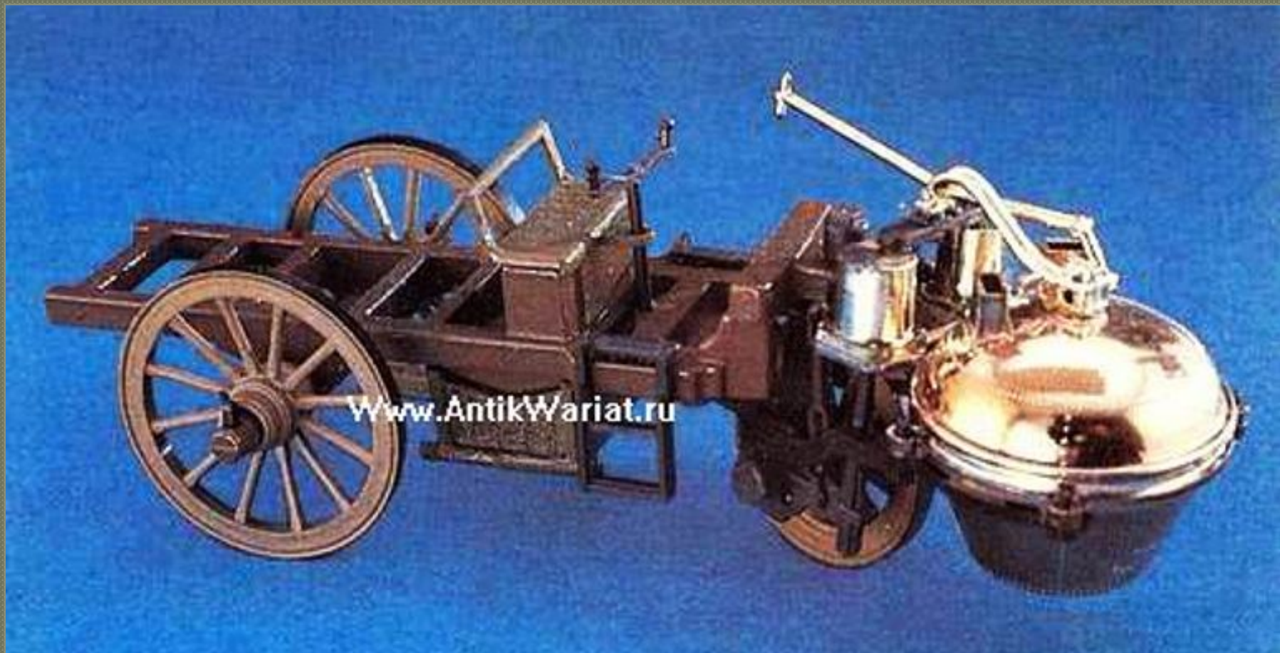
Паровая машина Франца Кюньо