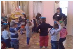
Игровое упражнение «Не урони мешочек»