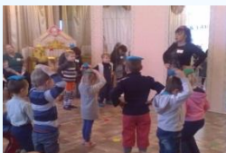
Игровое упражнение «Не урони мешочек»