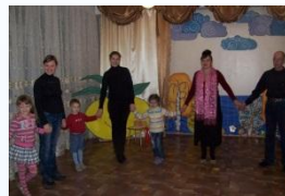
Упражнение «Общий ритм»