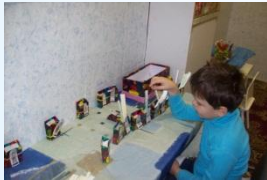
Индивидуальная диагностика детско-родительских отношений, автор Энтони Бине