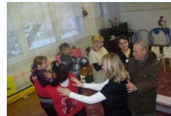
Упражнение «Ласковый дождик»