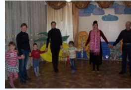
Упражнение «Общий ритм»