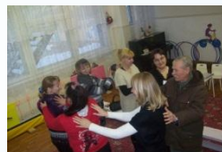
Упражнение «Ласковый дождик»