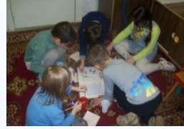
Диагностическая игра «Спасатели» - дошкольная зрелость, автор М. Битянова