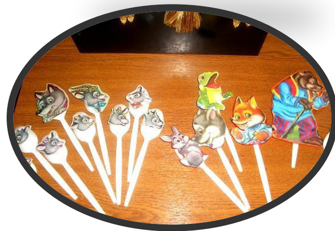
Театр на ложках