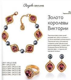
Золото королевы Виктории

Коллекция «Золото королевы Виктории» — это сочетание традиционных и современных элементов. В основе — натуральное золото, украшенное редкими камнями: рубином, изумрудом, сапфиром и черным бриллиантом. Коллекция включает ожив, серьги и кольцо. Кольцо: 20111 - 1970 руб. (118 88) Серьги: 20112 - 1000 руб. (118 88) Ожив: 20113 - 2700 руб. (118 88) Ожив: 20114 - 2700 руб. (118 88) Ожив: 20115 - 2700 руб. (118 88) Ожив: 20116 - 2700 руб. (118 88) Ожив: 20117 - 2700 руб. (118 88)