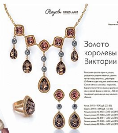
Золото королевы Виктории

Коллекция «Золото королевы Виктории» — это сочетание традиционных и современных элементов. В основе — натуральное золото, украшенное редкими камнями: рубином, изумрудом, сапфиром и черным бриллиантом. Коллекция включает ожив, серьги и кольцо. Кольцо: 20111 - 1970 руб. (118 88) Серьги: 20112 - 1000 руб. (118 88) Ожив: 20113 - 2700 руб. (118 88) Ожив: 20114 - 2700 руб. (118 88) Ожив: 20115 - 2700 руб. (118 88) Ожив: 20116 - 2700 руб. (118 88) Ожив: 20117 - 2700 руб. (118 88)