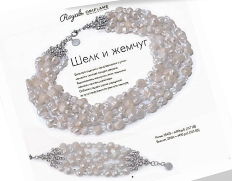
Шелк и жемчуг

Эта коллекция «Шелк и жемчуг» — это сочетание традиционных и современных элементов. В основе — натуральное золото, украшенное редкими камнями: рубином, изумрудом, сапфиром и черным бриллиантом. Коллекция включает ожив, серьги и кольцо. Кольцо: 20124 - 1490 руб. (118 88) Серьги: 20125 - 1100 руб. (118 88)