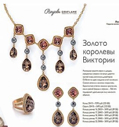
Золото королевы Виктории

Легендарный дизайн, роскошь и статусность. Золотые украшения с рубином и изумрудами. В комплект входят: ожерелье, серьги, кольцо.