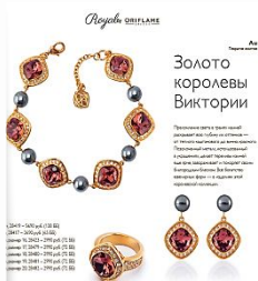
Золото королевы Виктории

Легендарный дизайн, роскошь и статусность. Золотые украшения с рубином и изумрудами. В комплект входят: ожерелье, серьги, кольцо.