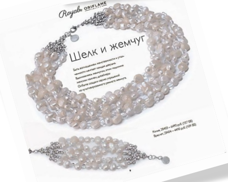
Шелк и жемчуг

Элегантный и романтичный дизайн. Украшения с черными алмазами. В комплект входят: ожерелье, серьги.