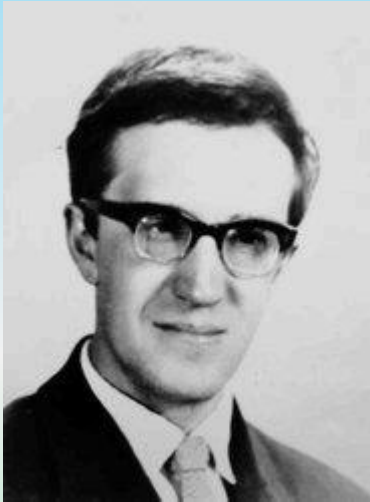
А.Е. Личко Эйдемиллер