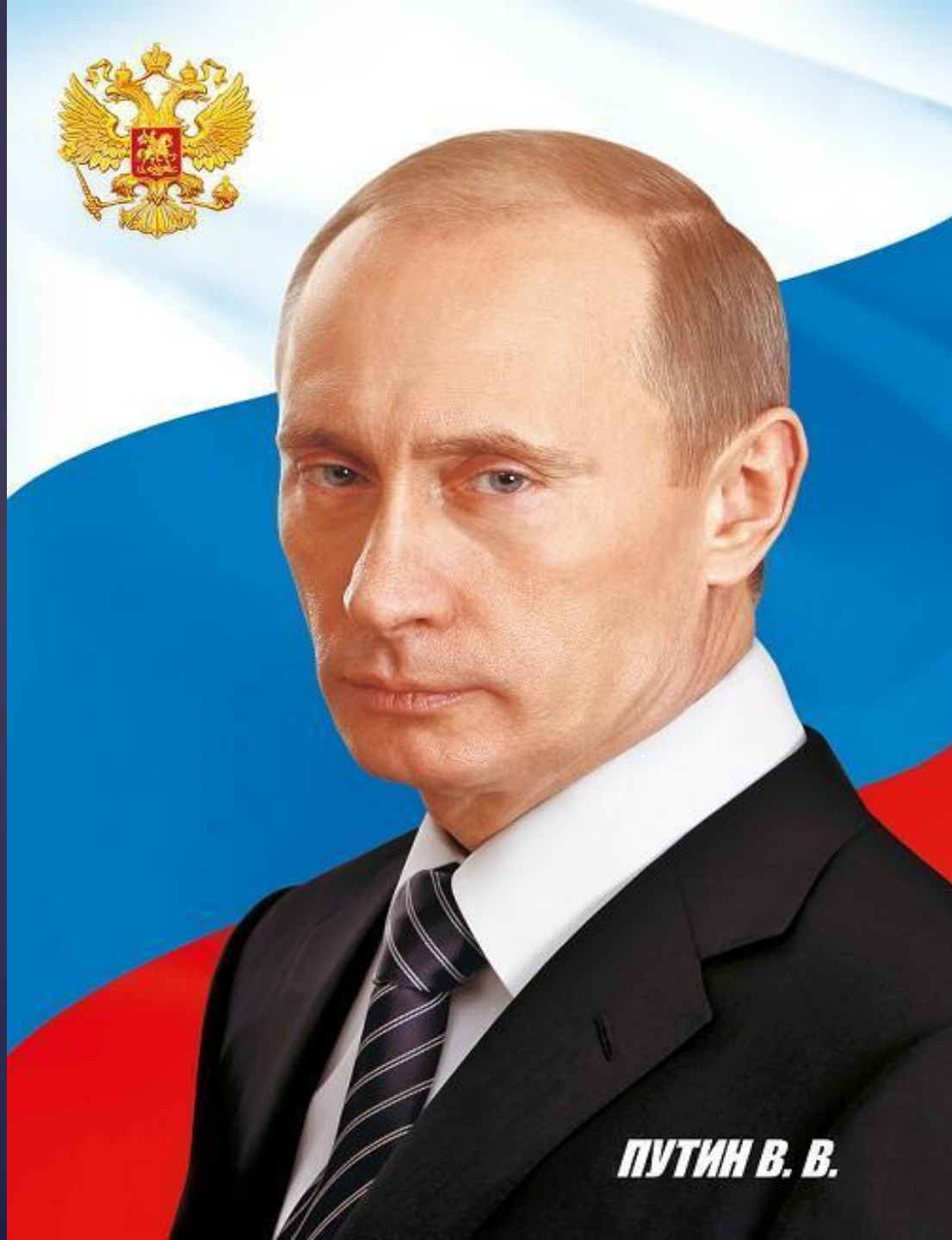
ПУТИН В. В.