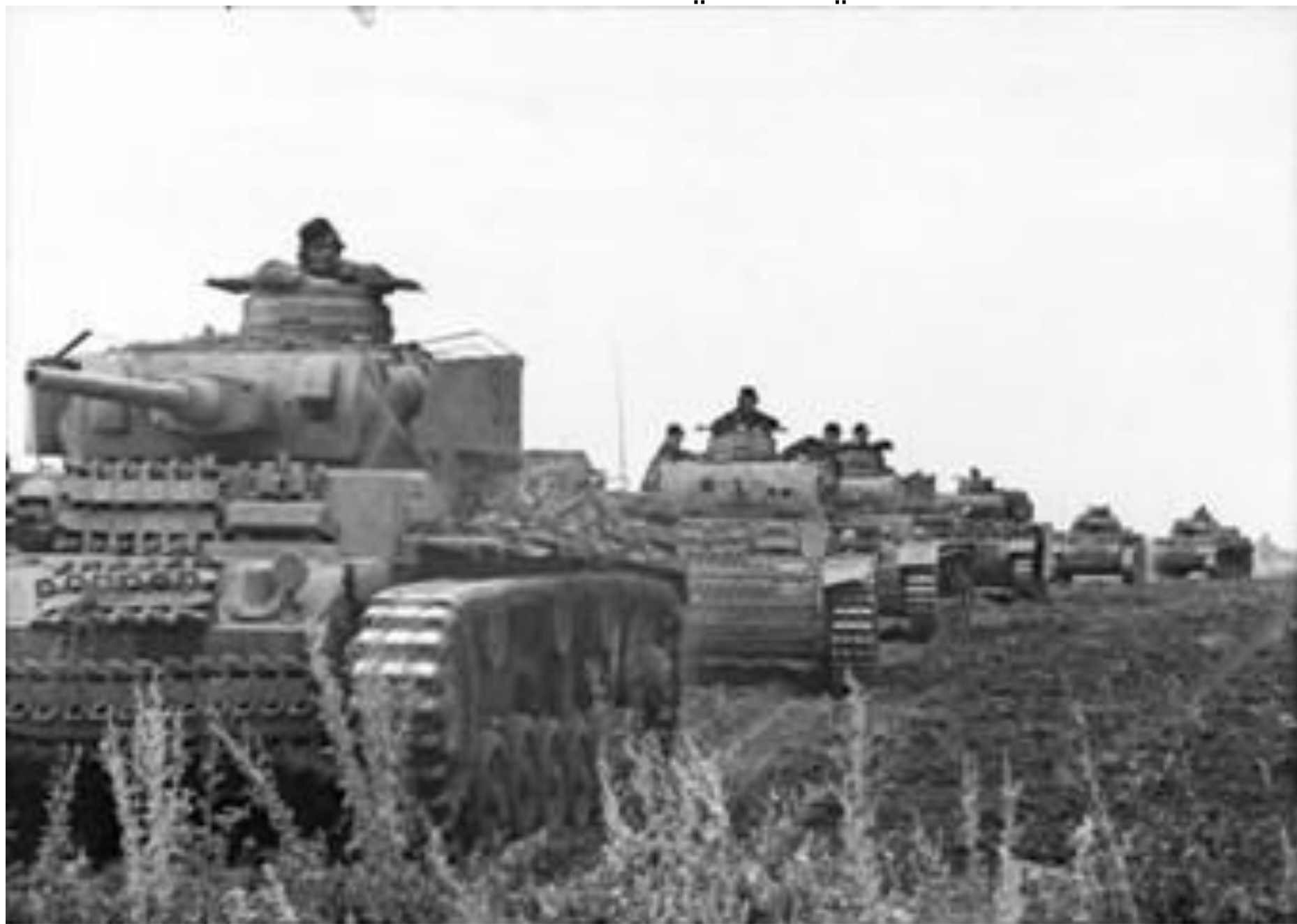
Солдаты. ВМ 011216-0002A08 | 1943 apr - 26