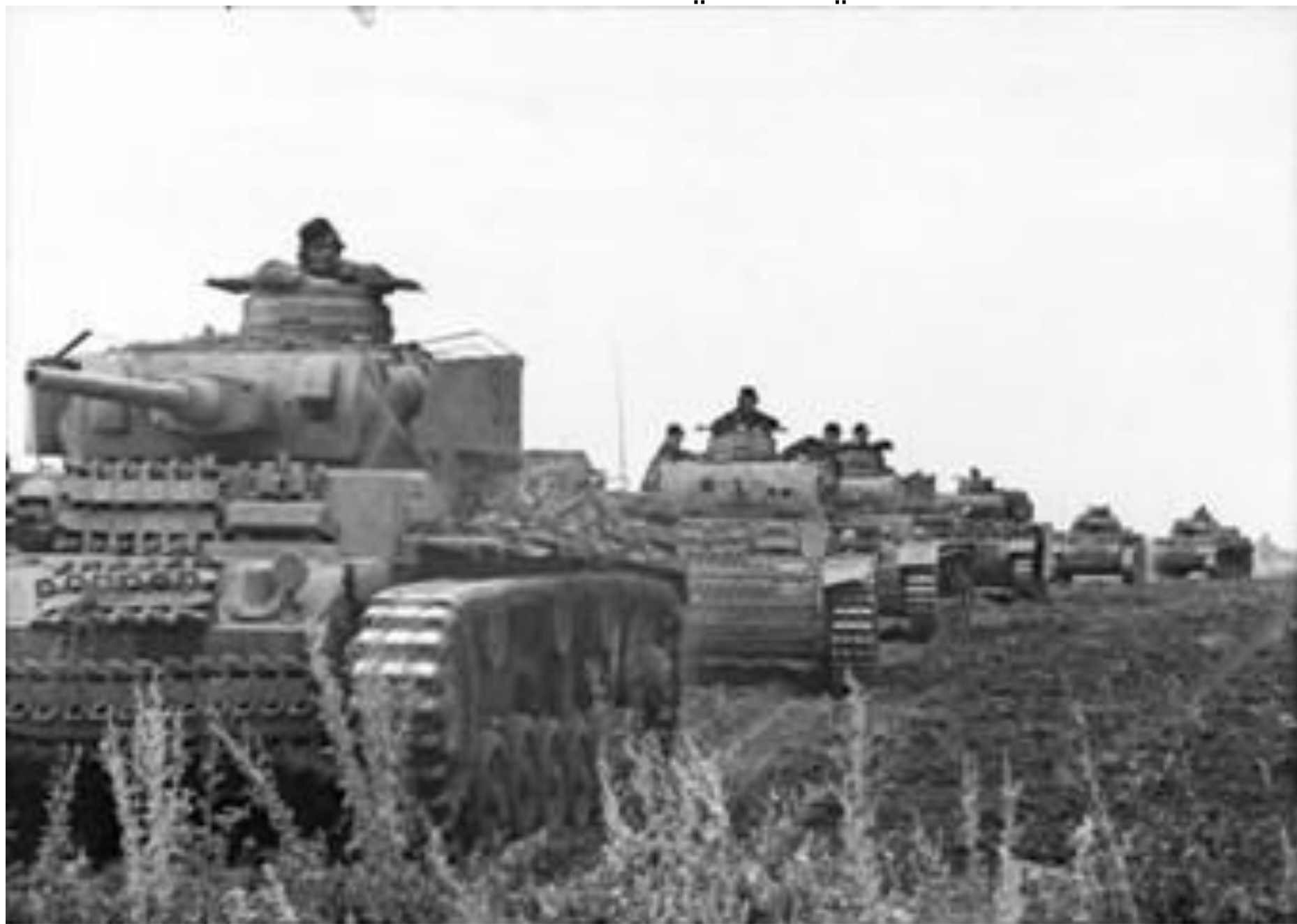
Самое начало. ВМФ 0111216-0002A08 | 1943 год | 20