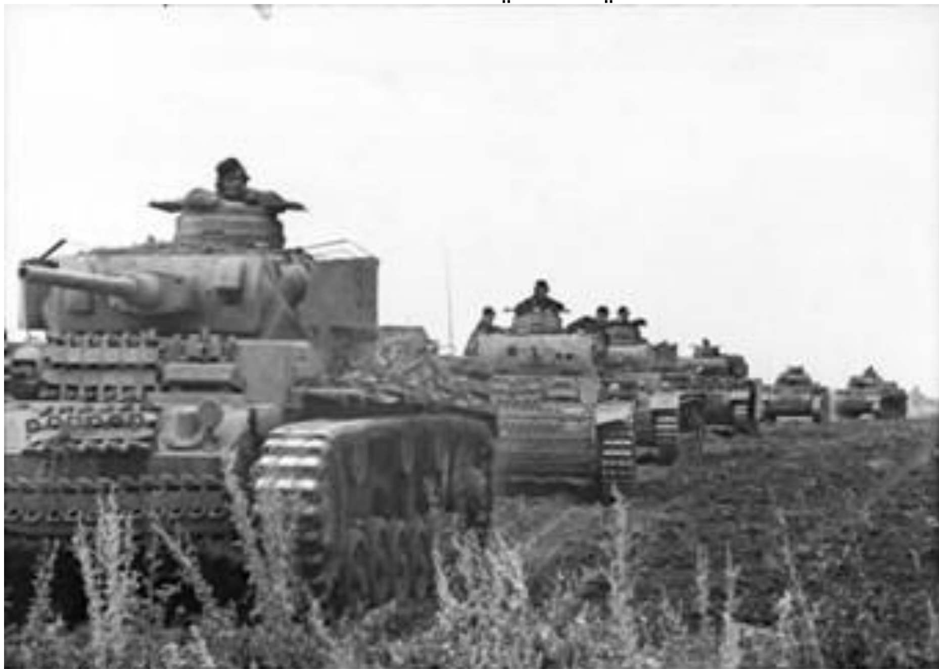
Солдаты на Т-34 в 1943 году 1943 год | 20