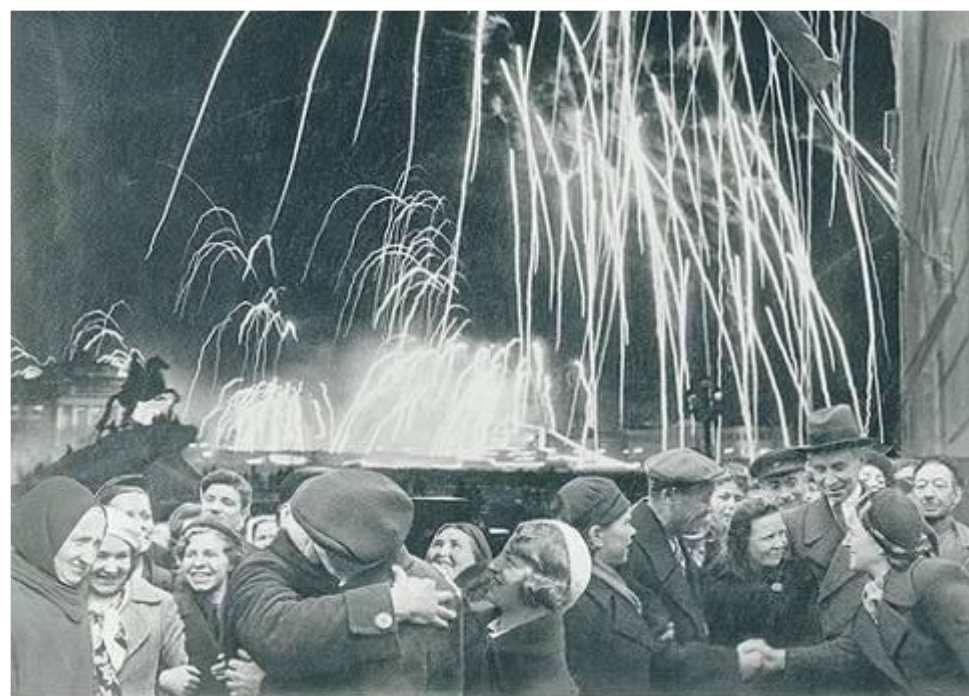
-ВЕЛИКАЯ ПОБЕДА ОДЕРЖАНА СОВЕТСКИМИ ВОЙСКАМИ ПОД ЛЕНИНГРАДОМ:

Победе радовалась вся страна, но эта радость была со слезами на глазах, так как в каждой семье, в каждом доме кто-то погиб на этой страшной войне.