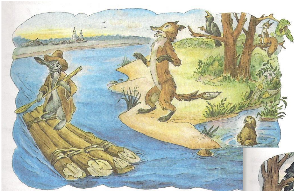
Заяц и лиса