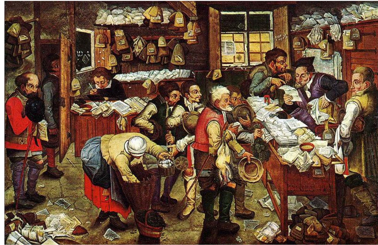
Питер Брейгель Младший , Уплата налога, 1640 год

Наиболее разработана концепция М.Вебера о рациональной бюрократии. Он определил бюрократию как «организацию с пирамидальной структурой власти, использующую силу действия универсальных и безличных правил, чтобы поддержать эту структуру и уделяющую главное внимание не дискреционным аспектам управления».