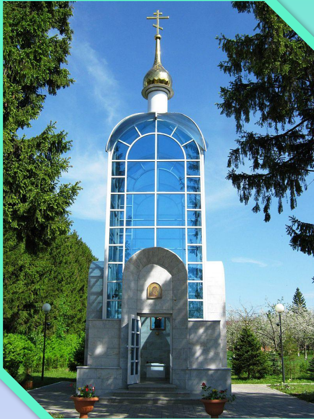
Часовня в селе Шоршелы, место захоронения космонавта А. Г. Николаева.

Дважды Герой Советского Союза также получил звание генерал-майора авиации, и продолжил свою деятельность в стенах Центра подготовки космонавтов. До 1992-го года Андриян Николаев находился на руководящих должностях в ЦПК. С 1994-го года работал в Мандатной комиссии Государственной думы РФ.