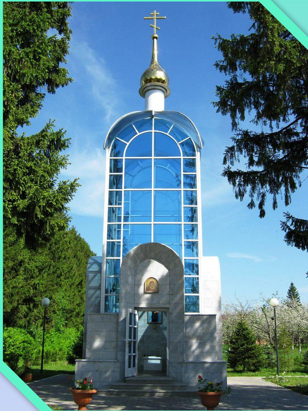
Часовня в селе Шоршелы, место захоронения космонавта А. Г. Николаева.

Дважды Герой Советского Союза также получил звание генерал-майора авиации, и продолжил свою деятельность в стенах Центра подготовки космонавтов. До 1992-го года Андриян Николаев находился на руководящих должностях в ЦПК. С 1994-го года работал в Мандатной комиссии Государственной думы РФ.