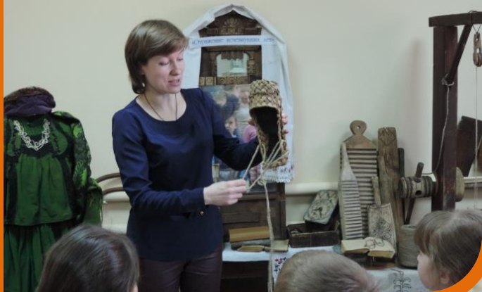
КРАЕВЕДЧЕСКИЙ МУЗЕЙ Беседа «Русская изба»