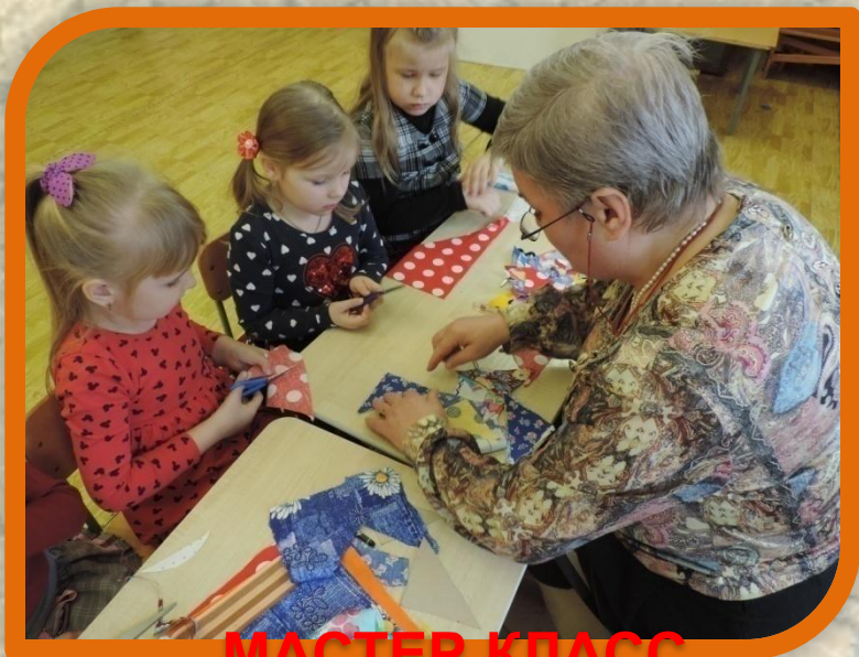
МАСТЕР-КЛАСС для девочек «Лоскутное шитье»