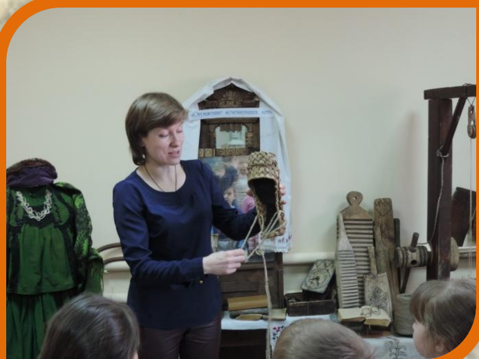
КРАЕВЕДЧЕСКИЙ МУЗЕЙ Беседа «Русская изба»