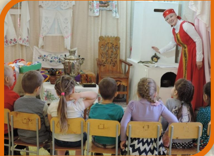
ООД «Русская печь»