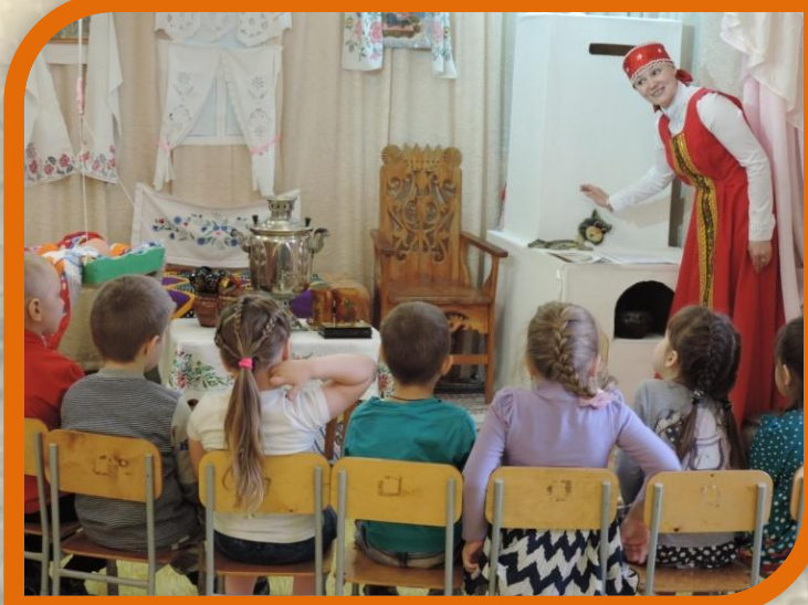
ООД «Русская печь»