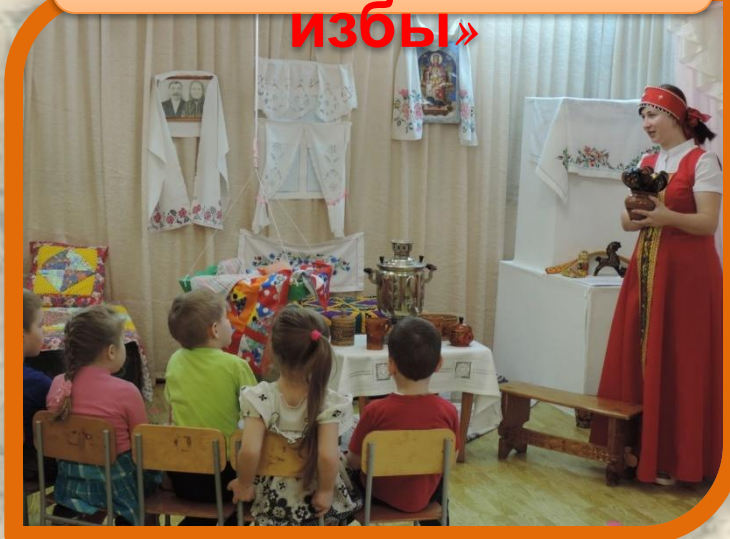
МАСТЕР-КЛАСС для мальчиков «Русская изба»