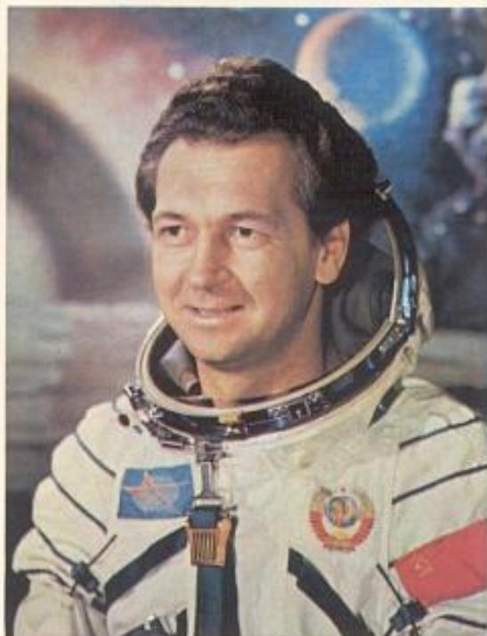
Дважды Герой Советского Союза, летчик-космонавт СССР Виталий Иванович СЕВАСТЬЯНОВ