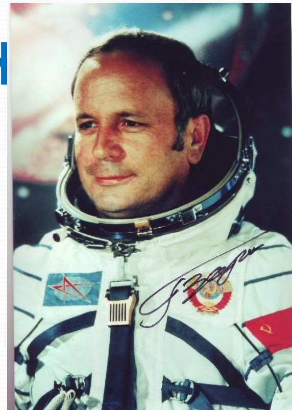
Горбатко Виктор Васильевич