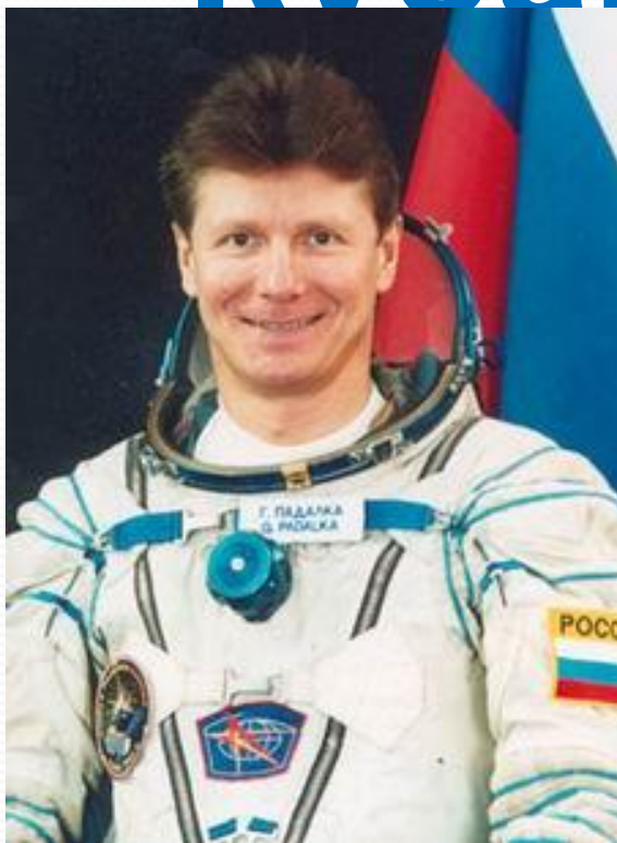
Геннадий Иванович Падалка