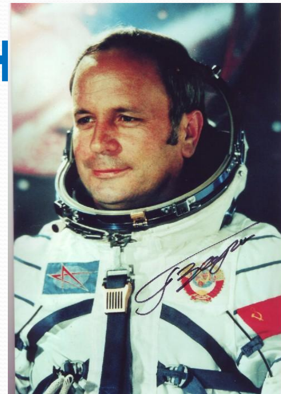
Горбатко Виктор Васильевич