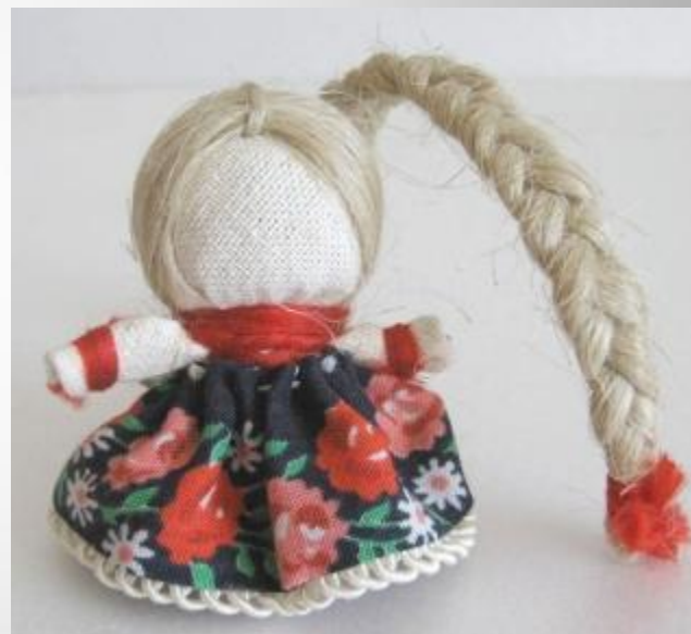
Куколка на здоровье, счастье