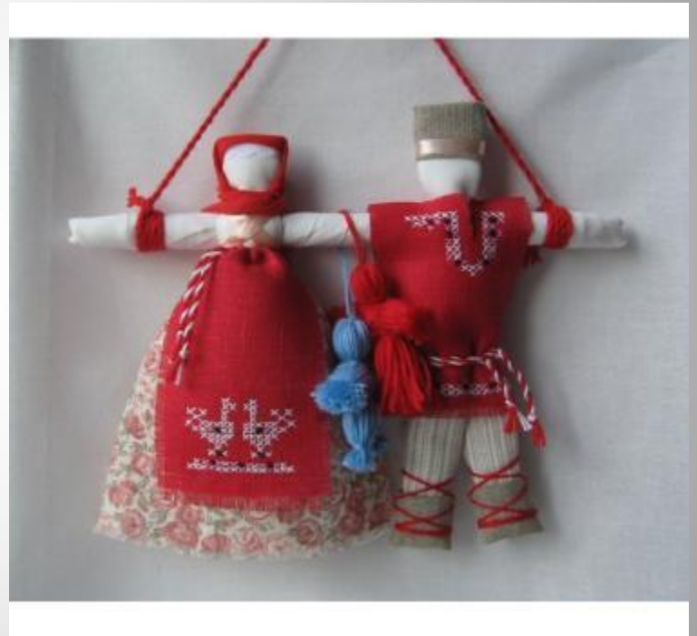
Куклы - Неразлучники