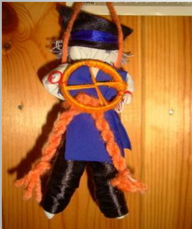
Спиридон - Солнцеворот