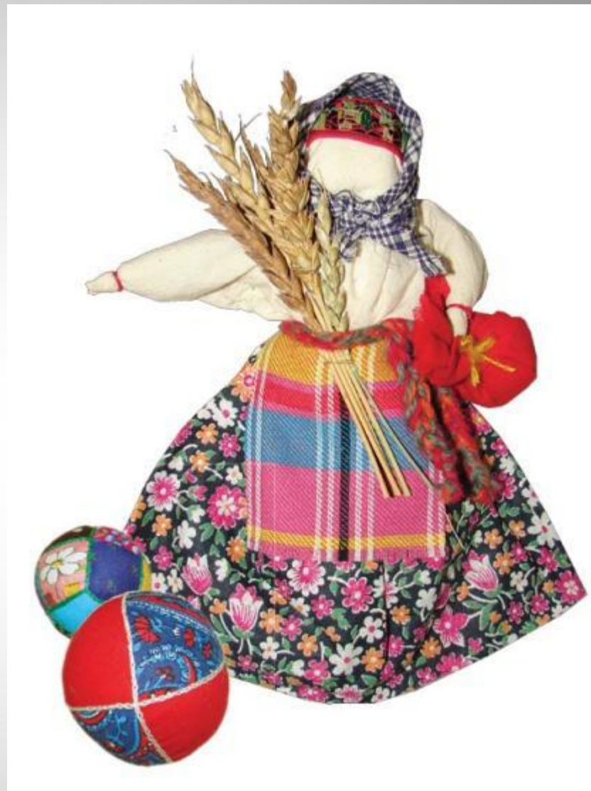
Кукла - Жница