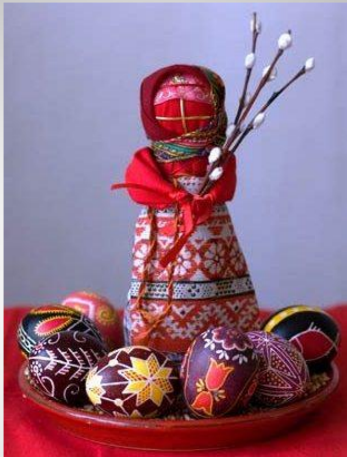
Кукла - Пасха