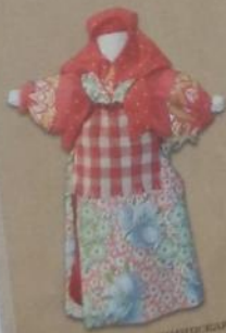
Свадебная кукла из Вологодской