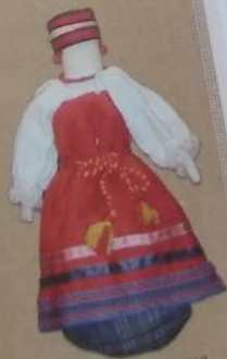
Свадебная кукла из Вологодской