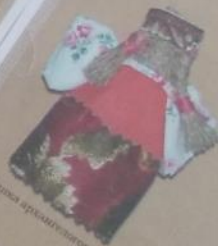
Свадебная кукла из Вологодской