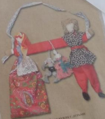
Свадебная кукла с детьми