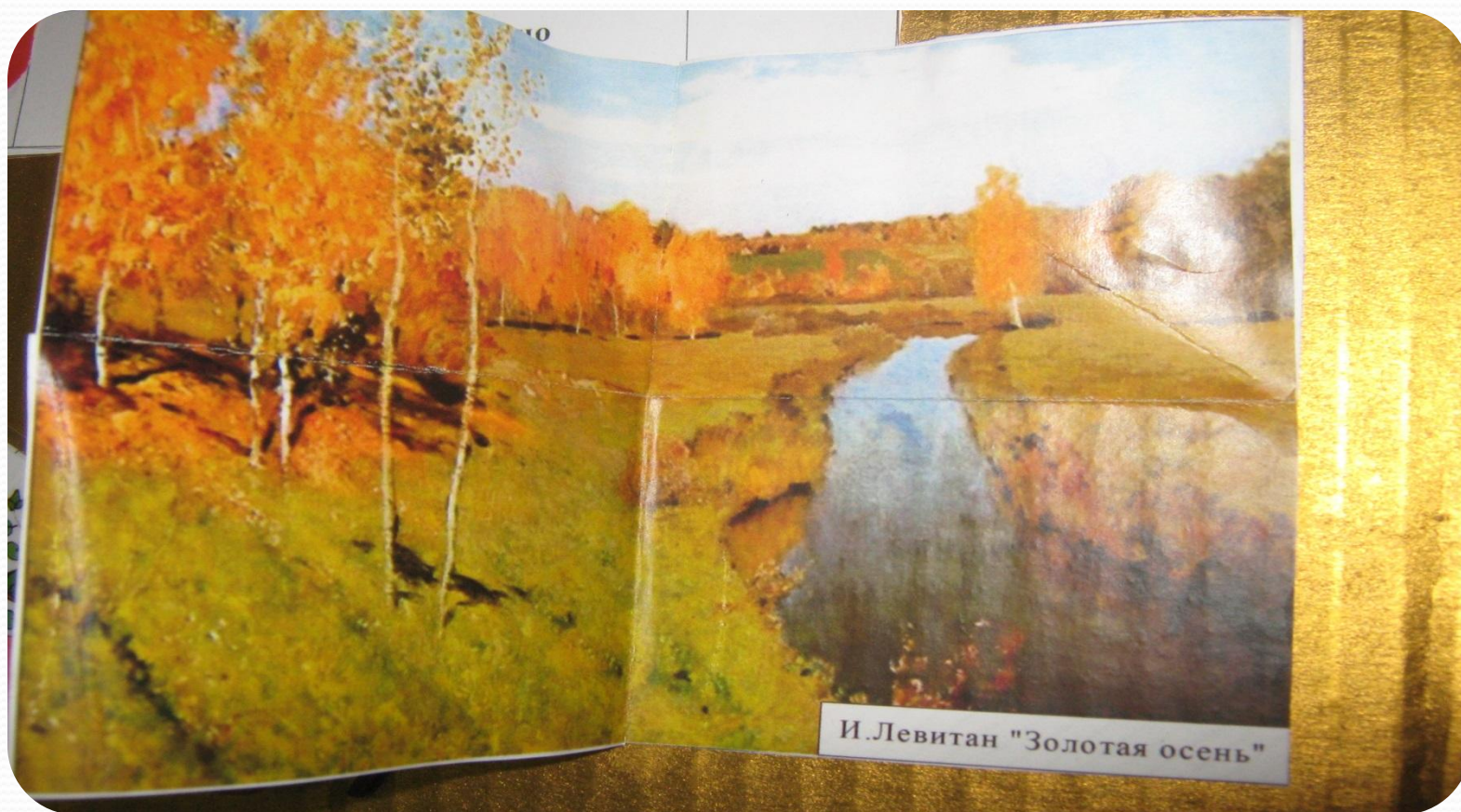
И. Левитан "Золотая осень"