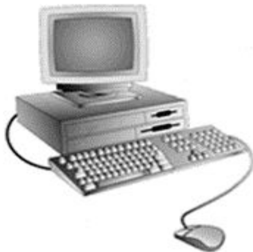
Посмотреть в Интернете