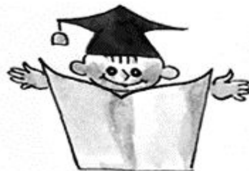
Спросить у специалиста