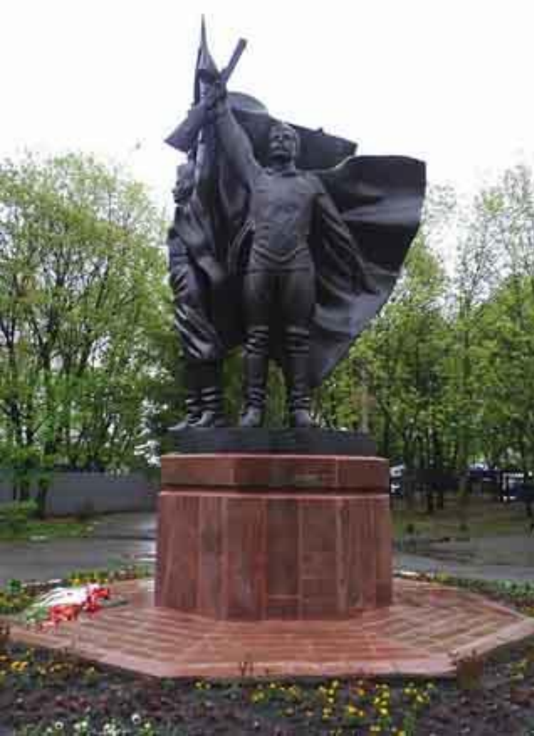
Памятник «Победа в Отечественной войне»