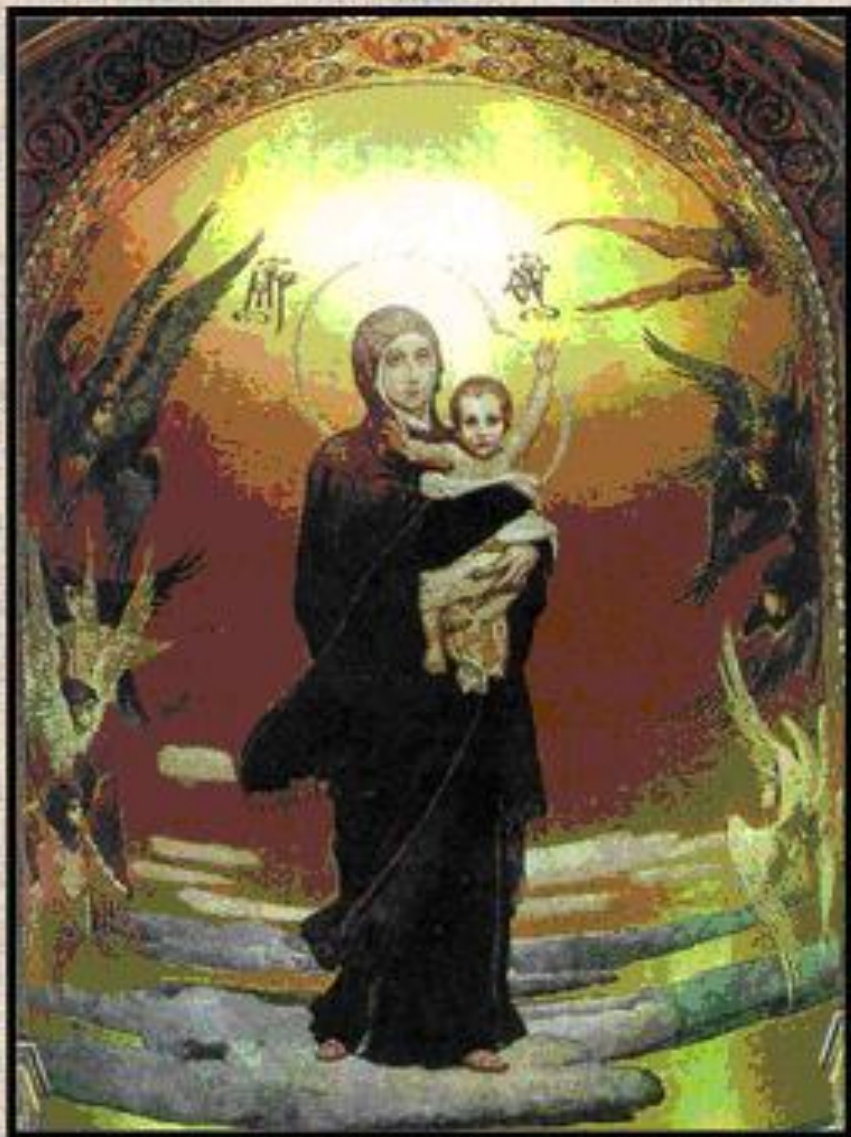
В. Васнецов «Богоматерь с младенцем»