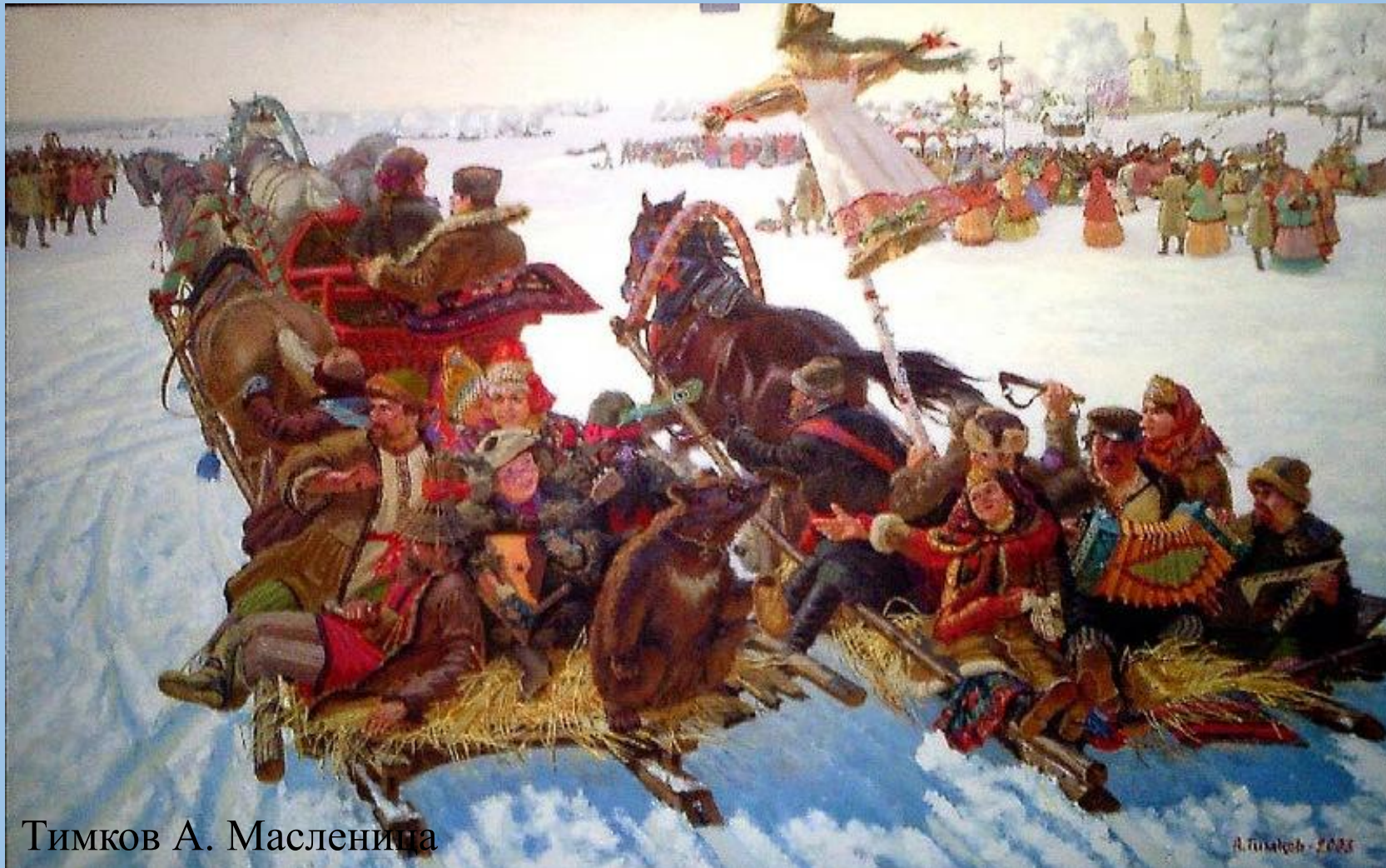
Тимков А. Масленица

Когда катались на санях, то сани следовали друг за другом так, что получался один длиннющий поезд, ездивший из деревни в деревню. Въезд такого поезда, ожидавшегося с нетерпением, и назывался встреча Масленицы.