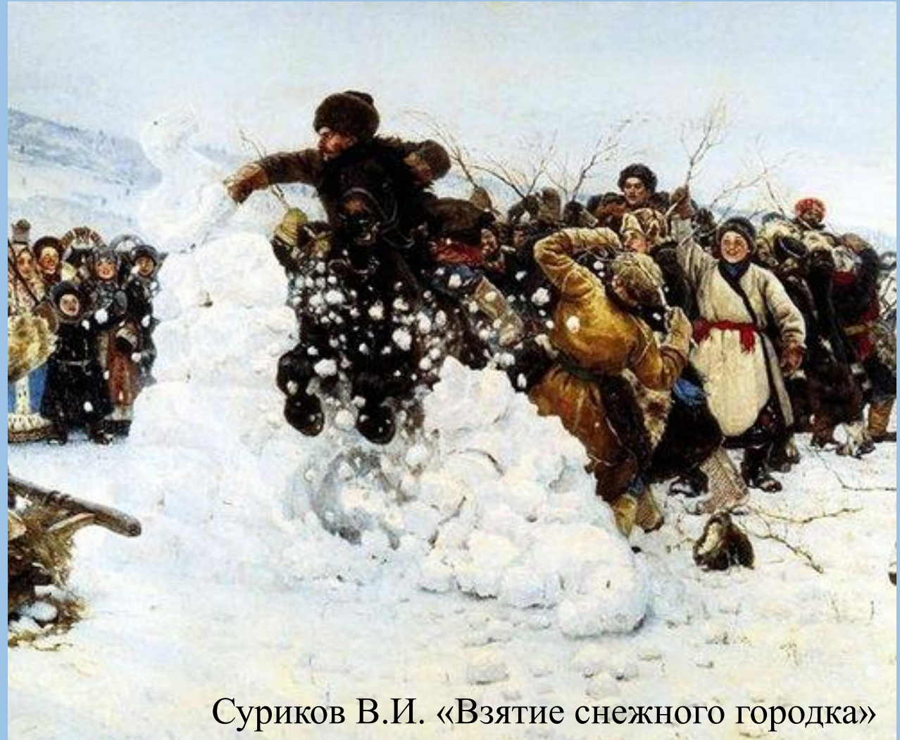
Суриков В.И. «Взятие снежного городка»