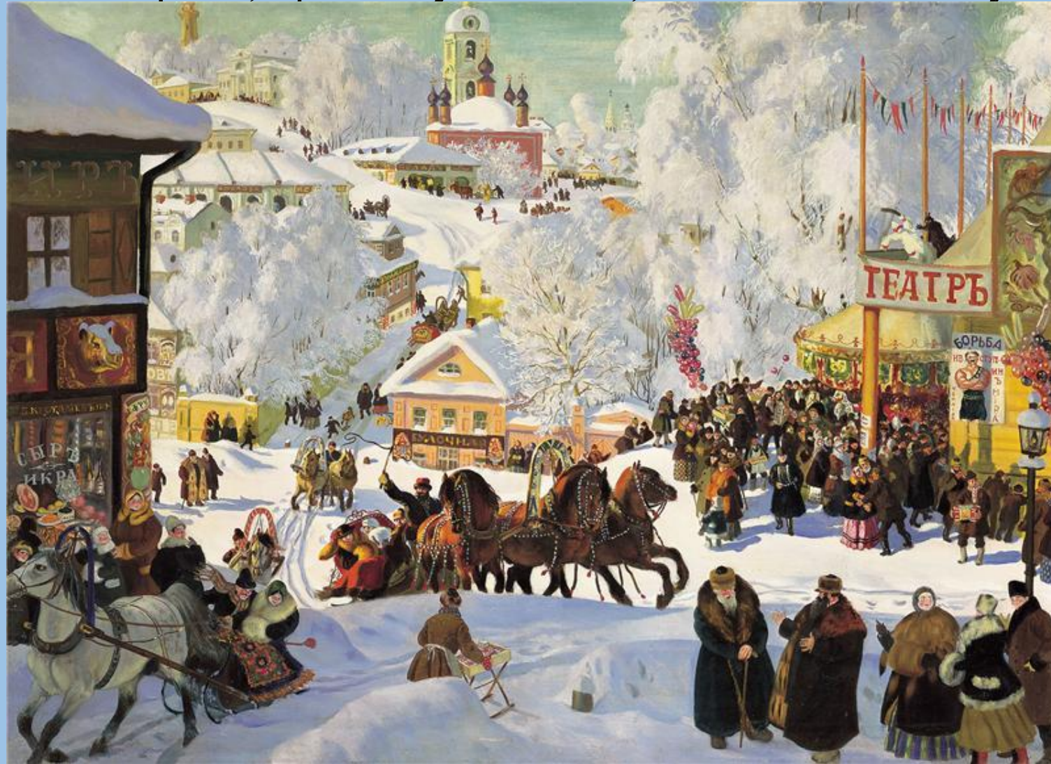
Кустодиев Б.М. «Масленица»

Масленица имела второе название «проводы зимы». В Масленицу каждый человек должен был помочь прогнать зиму и разбудить природу. Люди, забывали про холода, зимние морозы, про тоску и печаль, и веселились от души.