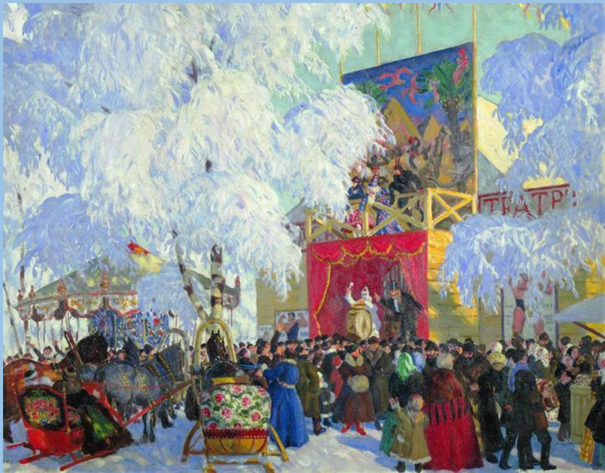
Кустодиев Б.М. «Балаганы»

Для всеобщего веселья на площадях устраивали ярмарки с множеством товаров, балаганы – маленькие театры, показывали шуточные спектакли, дрессированных зверей, скоморохи пели веселые песни и подшучивали над зеваками.