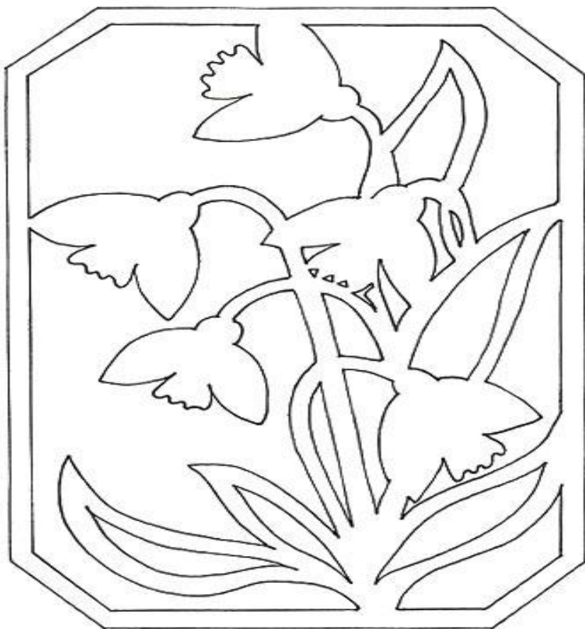
Трафарет для открытки