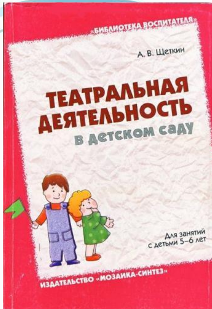
Автор: Анатолий Щёткин Издательство: «Мозаика – Синтез», 2007 г.