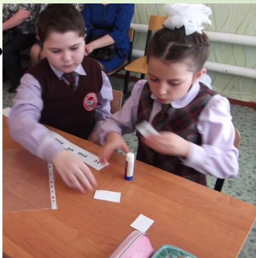
«Собери слово из слогов»