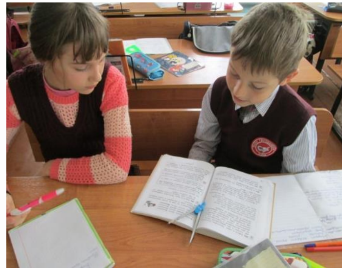
«Охота за сокровищами»