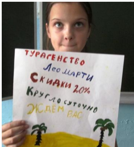
Деловая игра «Я-предприниматель»