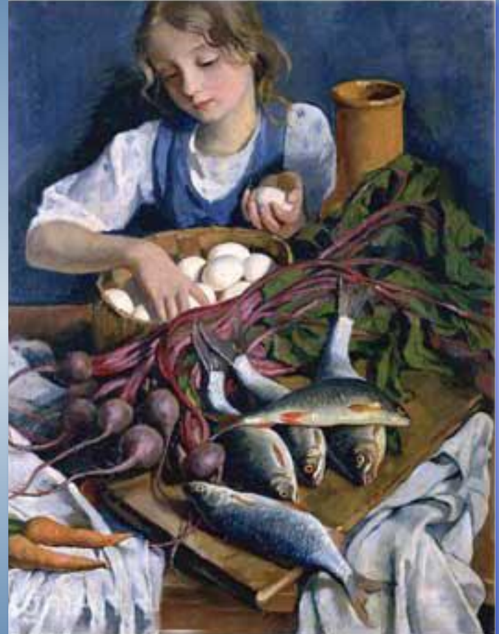
З. Серебрякова. Портрет Кати