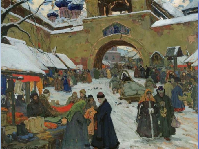
И. Горюшкин-Сорокопудов. Базарный день в старом городе