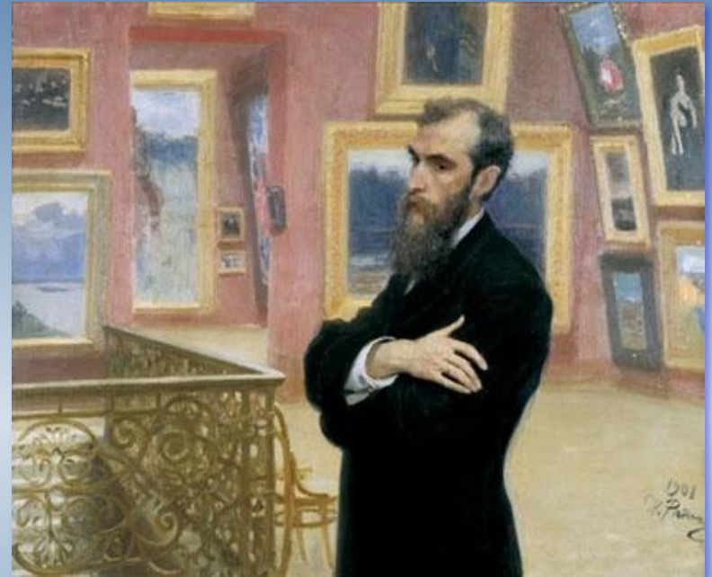
И. Репин. Портрет П. М. Третьякова