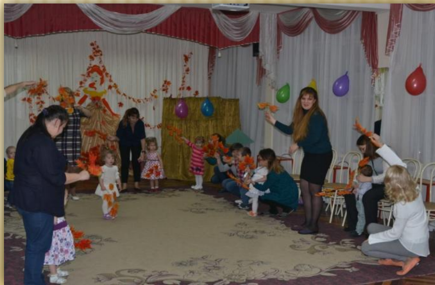
Фото 4. «Танец с осенними листочками». Звучит композиция «Листики кленовые»