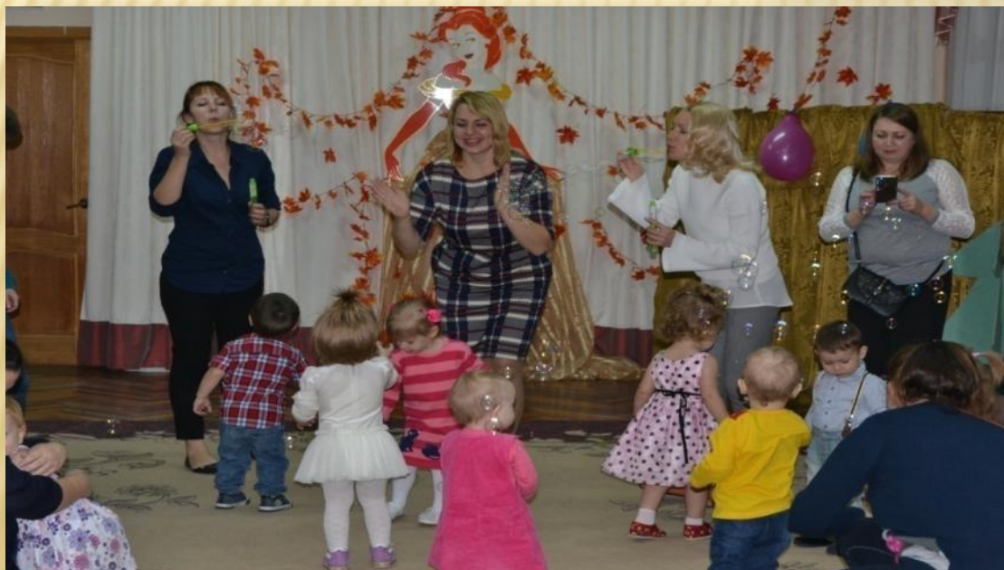
Фото 6. Дети ловят и лопают руками мыльные пузыри под композицию «Мыльные пузыри»