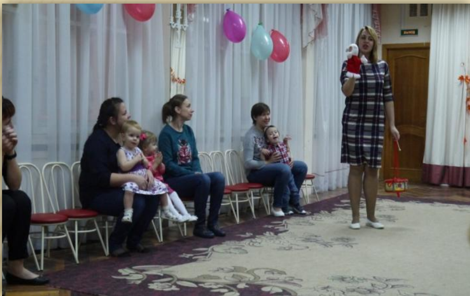
Фото 3. «В гости к нам пришёл музыкальный зайчик»