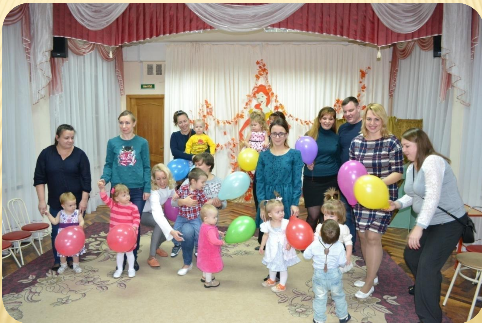
Фото 7. Дарим детям воздушные шары, приглашаем участников праздника вместе сфотографироваться