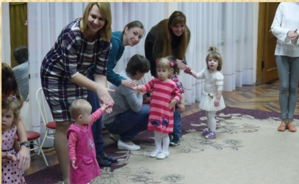
Фото 2. Под песню «Ладочка» мамы гладят ручку своего ребенка