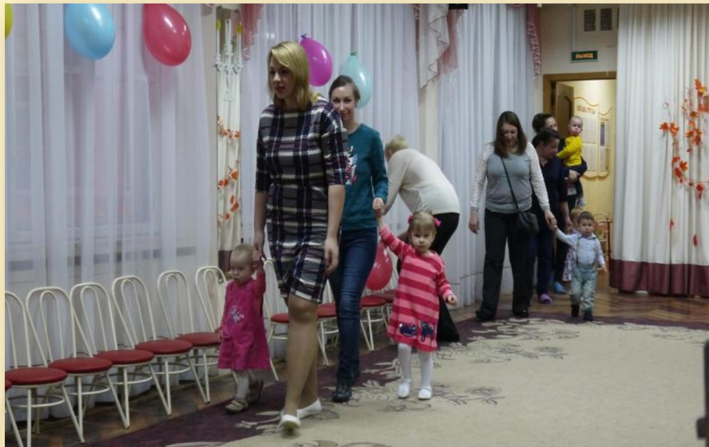
Фото 1. Дети с родителями входят в зал. Звучит композиция «Топ-топ»