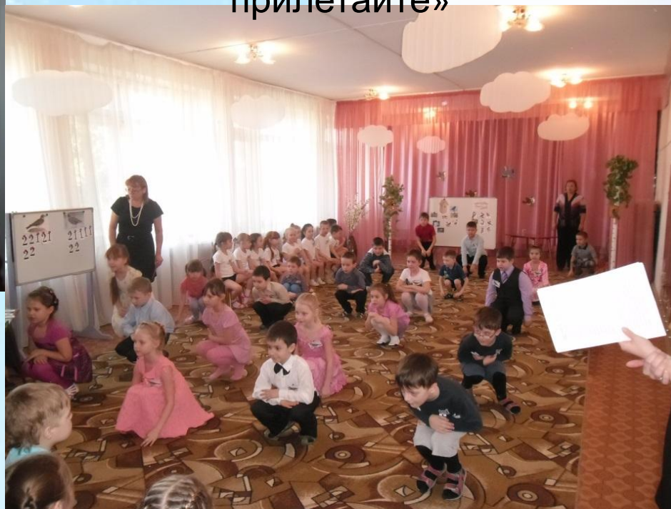
КВН «Птицы в гости прилетайте»