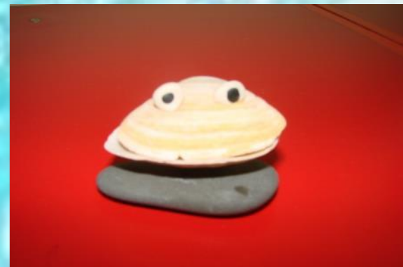
«Лягушка» И. Саша