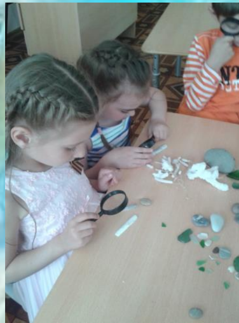
какие длинные ракушки