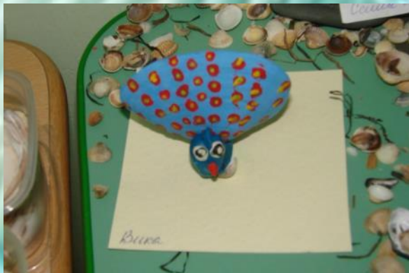
«Жар Птица» М.Вика