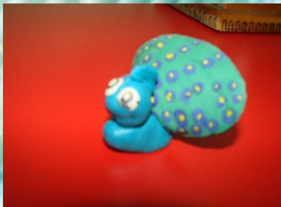
«Жар Птица» Г.Маруся