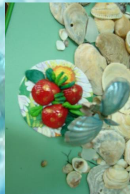
«Бабочка и ягоды» К. Саша