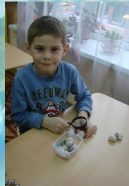
а эти круглые ...