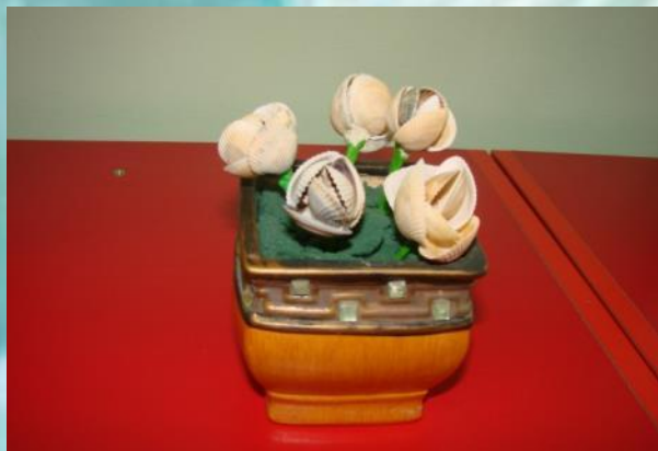
«Цветы в горшке» З. Марина