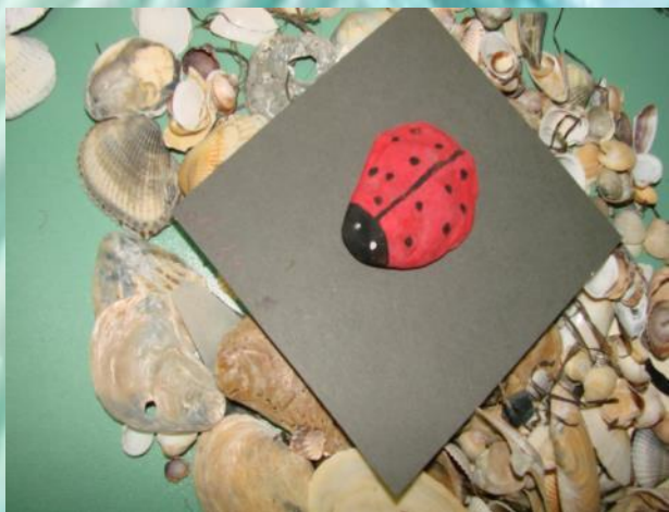
«Божья коровка» П. Вероника