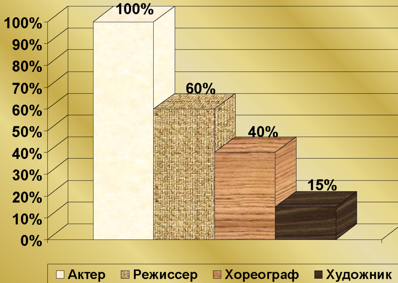
Диаграмма наиболее популярных ответов детей по теме "Театральные профессии"