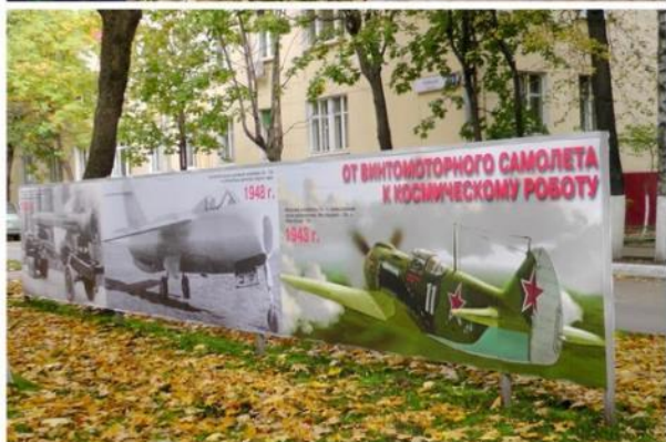
Аллея героям труда