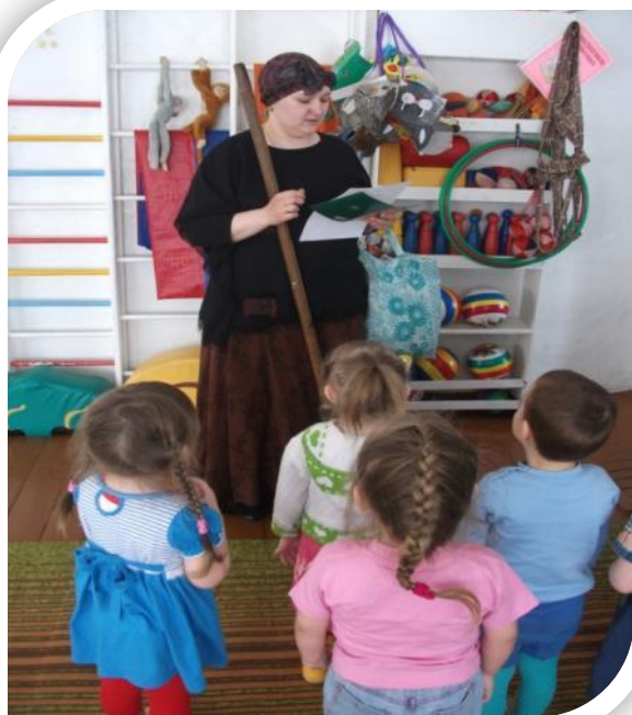
Развлечение «Потерянные игрушки»