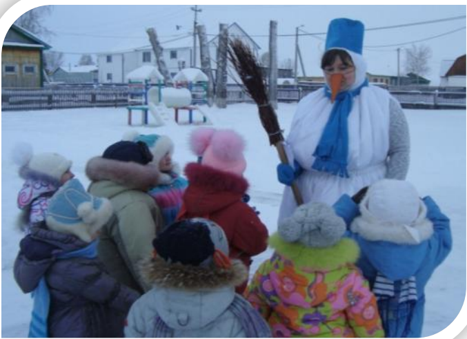
Развлечение «В гостях у Снеговика»