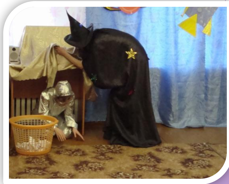
Развлечение к Дню космонавтики