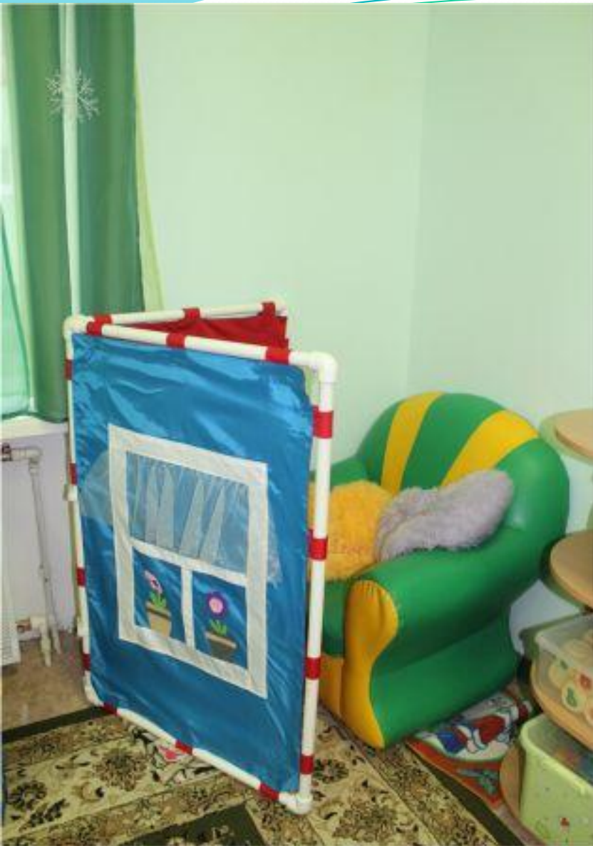
Спокойный сектор. Место для отдыха и уединения.