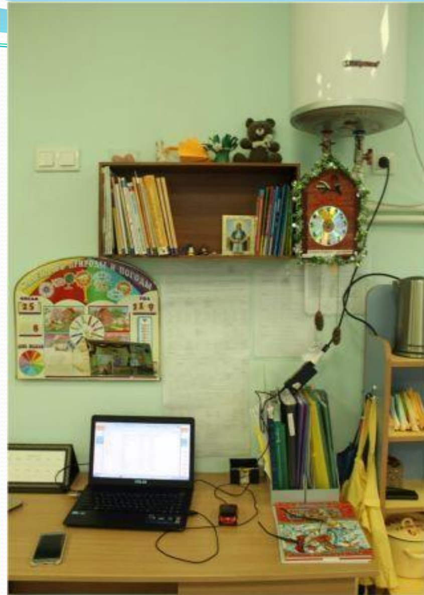
1.7. Рабочий сектор (ИКТ для педагога)