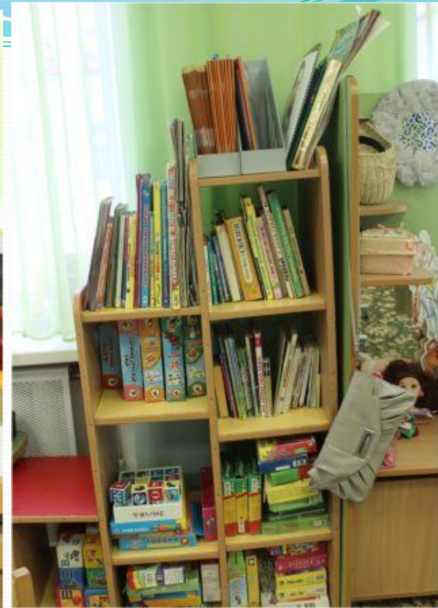
Спокойный сектор. Книжный уголок.