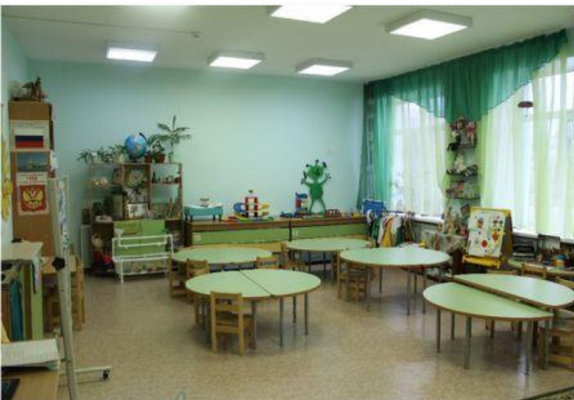
Вход в группу, нижняя правая точка