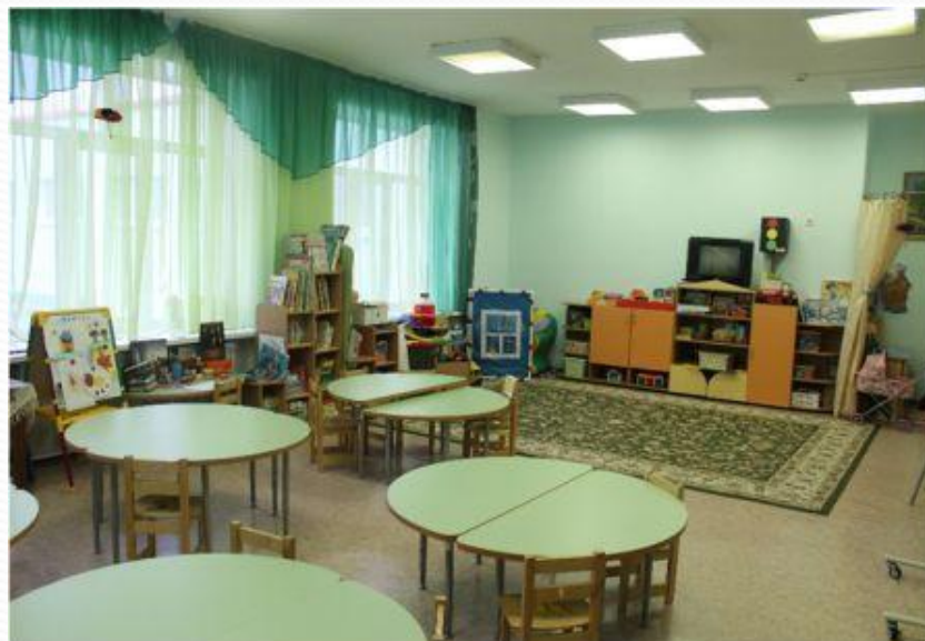
Нижняя левая точка

Вид (ранний возраст, младший, старший , подготовительный – нужное подчеркнуть)