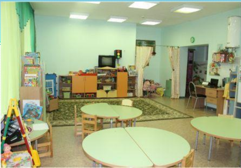
Верхняя левая точка