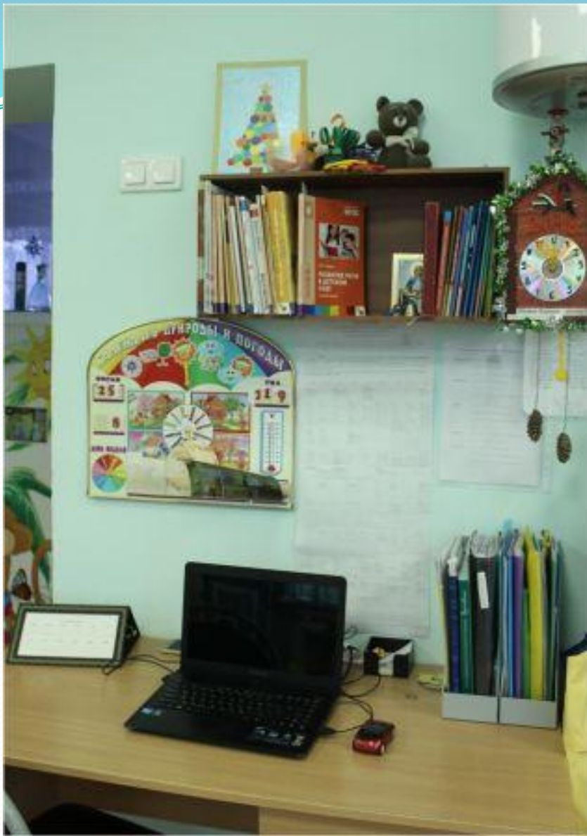
1.6. Рабочий сектор (методическая литература педагога)