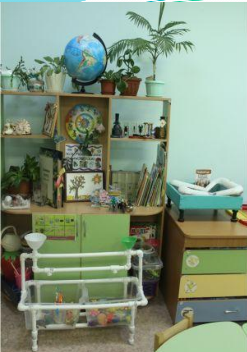
Рабочий сектор. Исследовательская деятельность