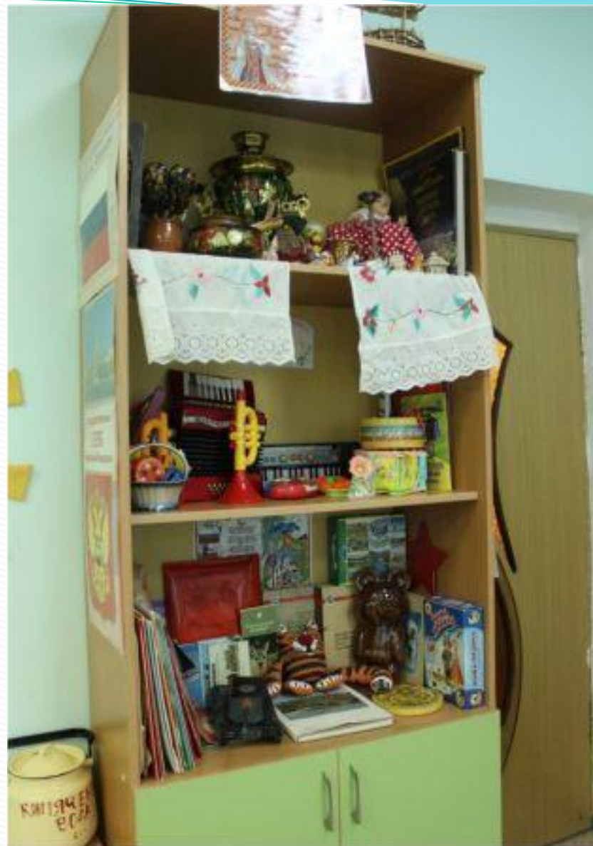
Наследие культуры и социокультурные ценности.