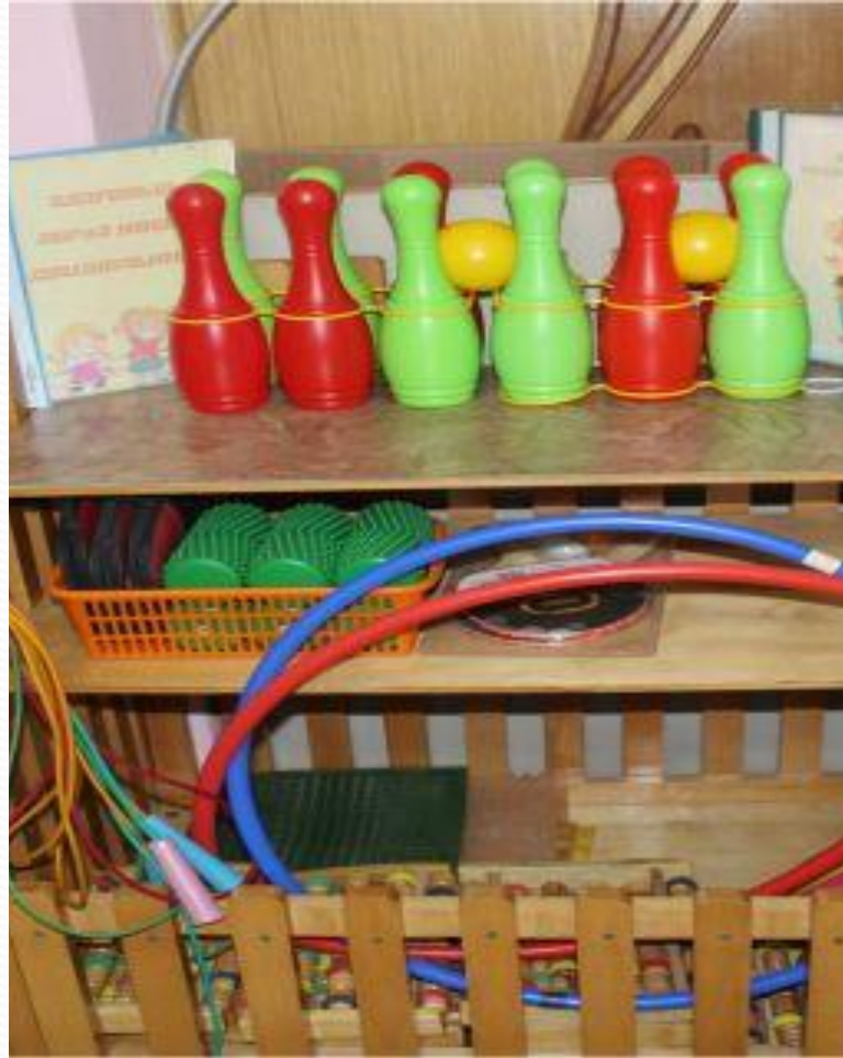
Активный сектор. Вариативный модуль «Физкультура и спорт»