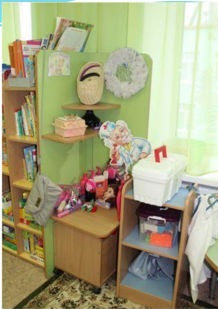
Рабочий сектор. Трансформируемое пространство для сюжетно-ролевых игр.