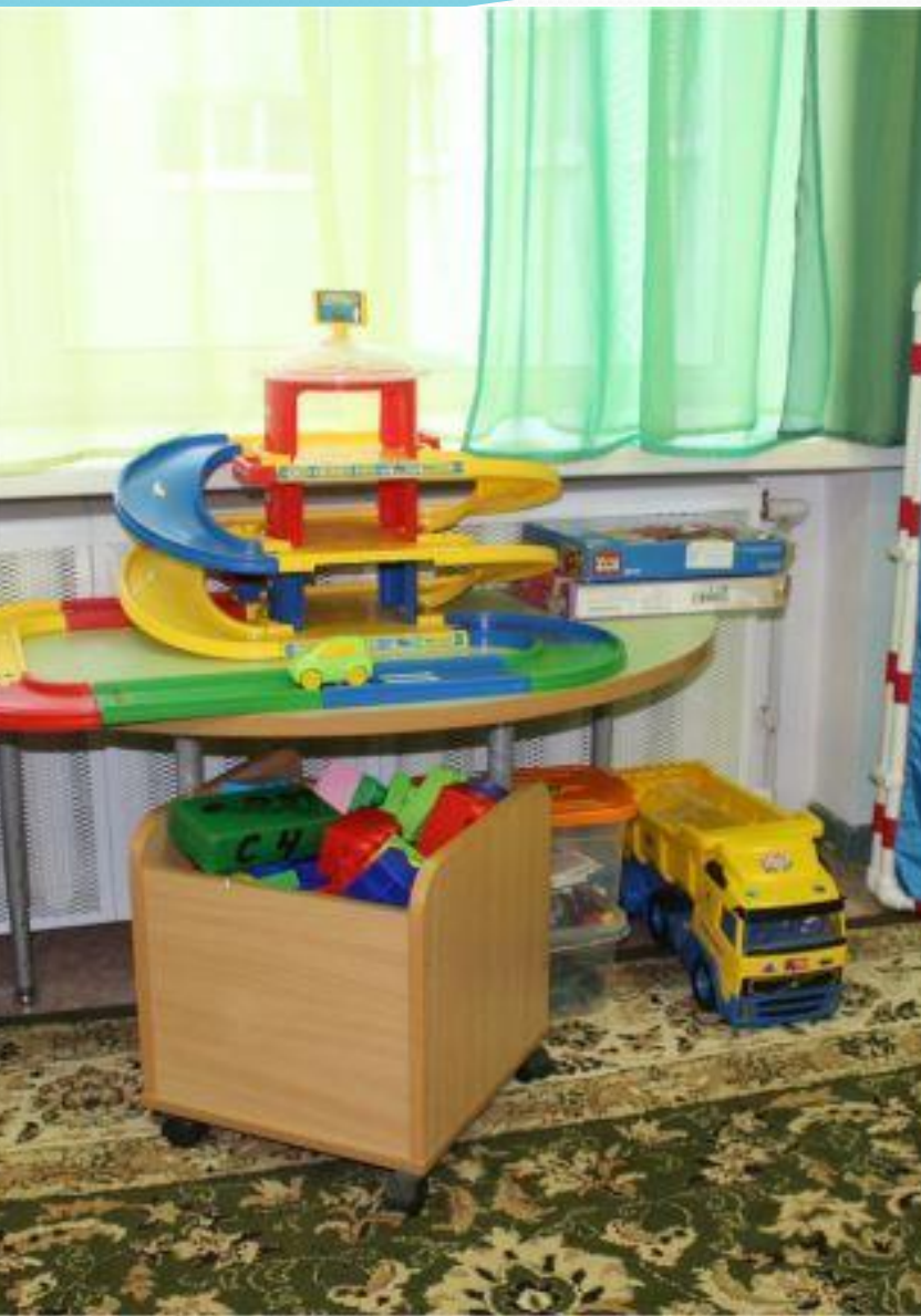
Рабочий сектор. Сенсорика-конструирование.