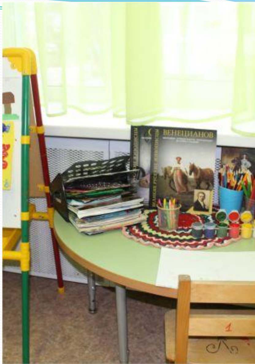
Спокойный сектор. Дизайн-студия и центр творчества.