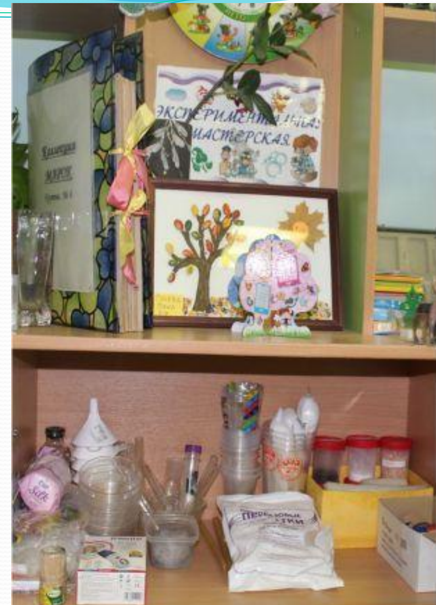
Рабочий сектор. Исследовательская деятельность.