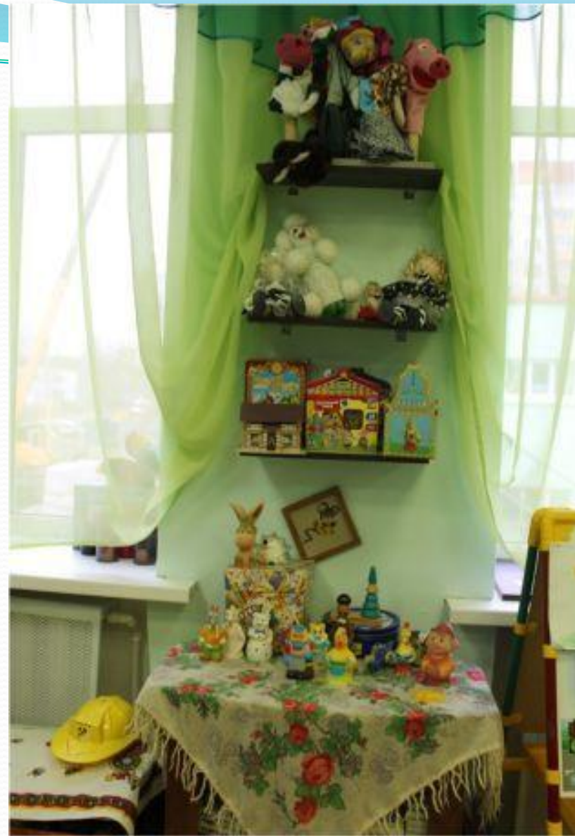
Активный сектор. Музыкально-театрализованная деятельность.