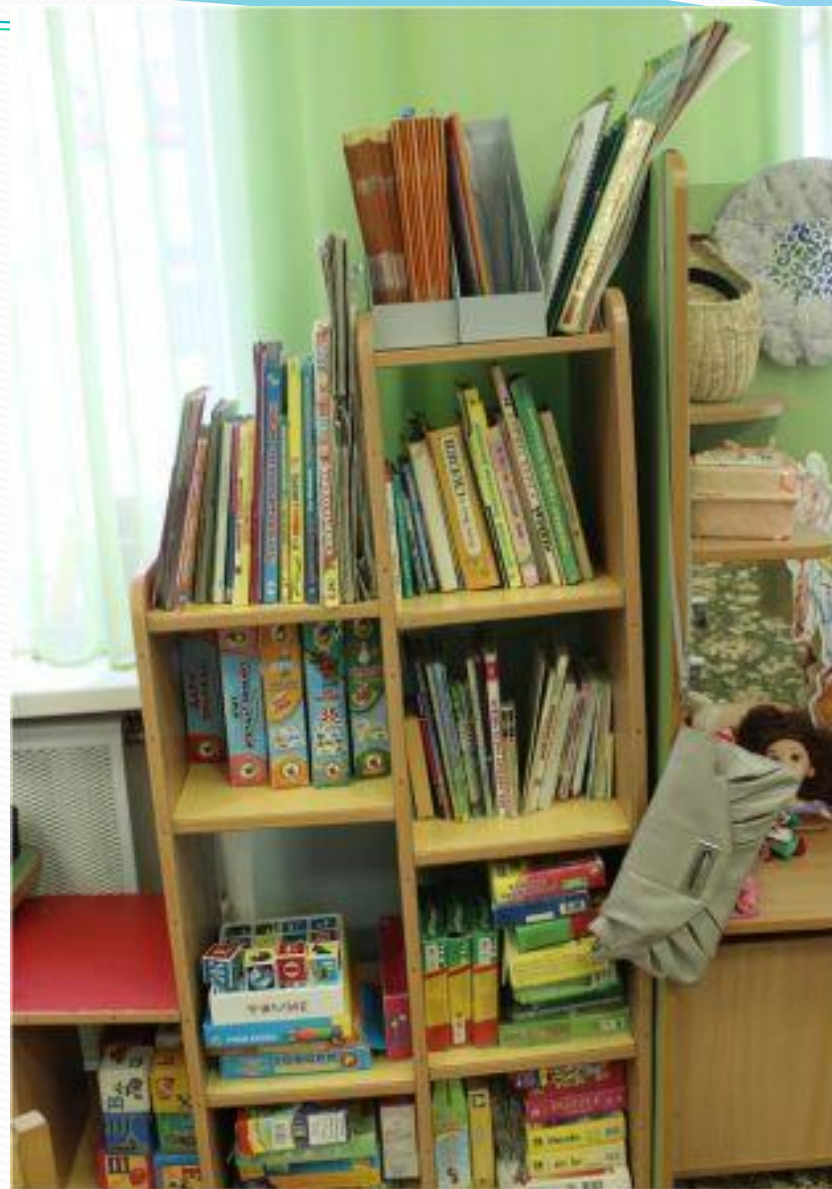
Рабочий сектор. Обучающее пространство.