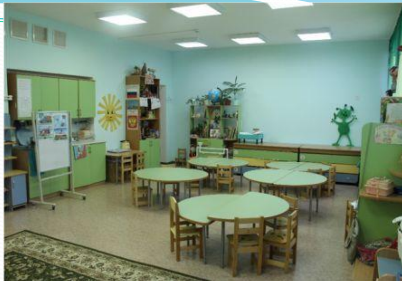
Верхняя правая точка