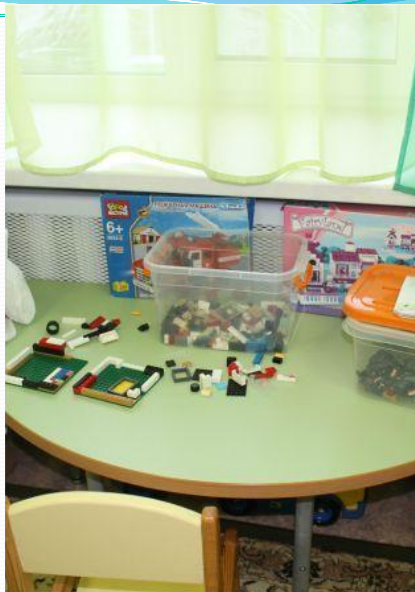
Рабочий сектор. Конструирование.