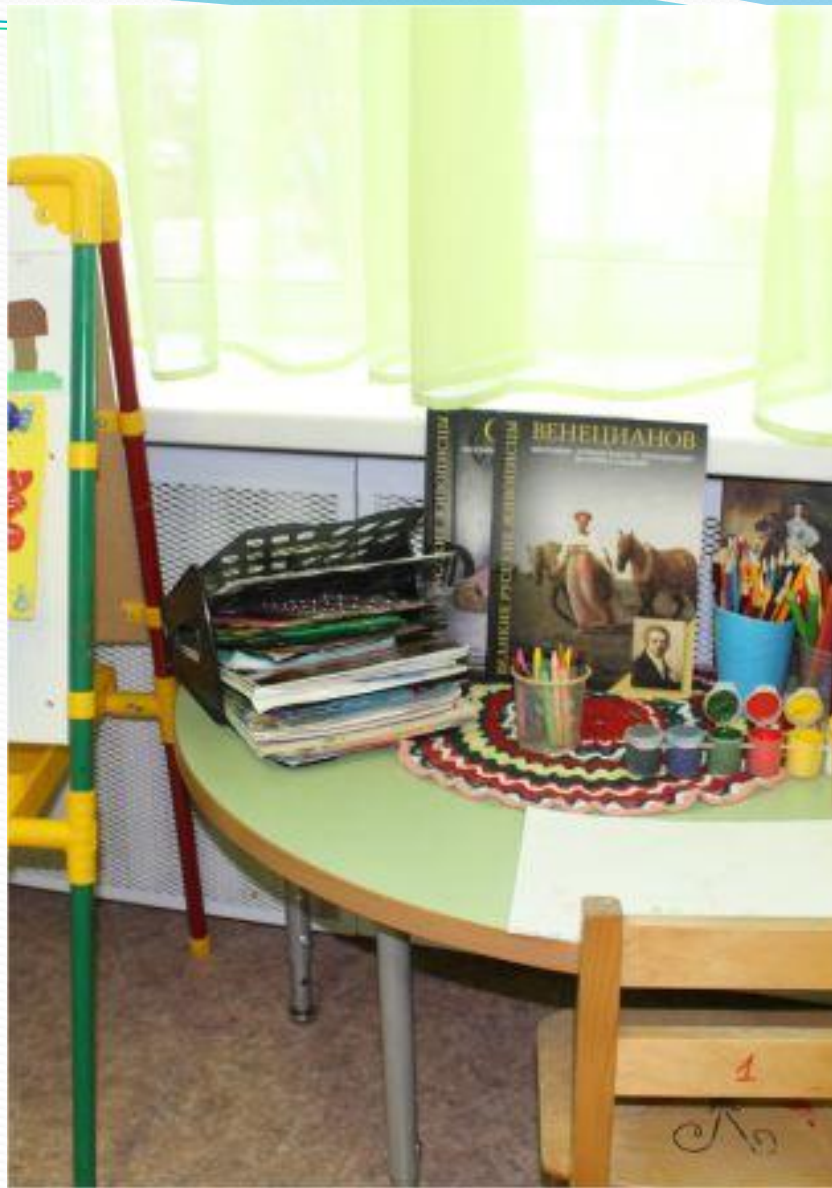
Спокойный сектор. Дизайн-студия и центр творчества.