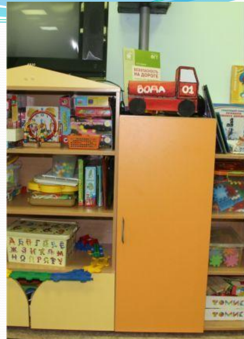
Рабочий сектор. Сенсорика. Математическое развитие.