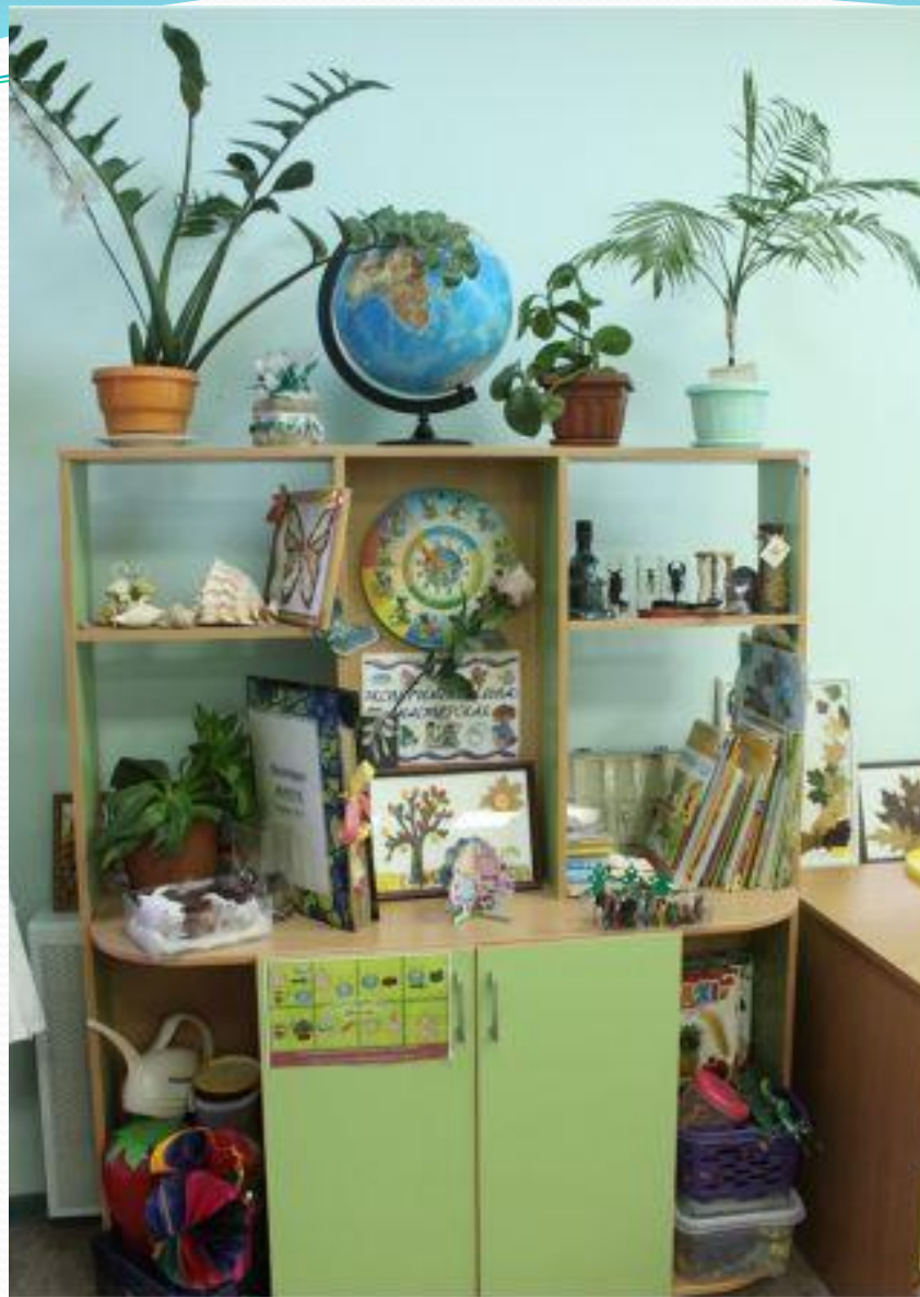
Рабочий сектор. Наука и природа.