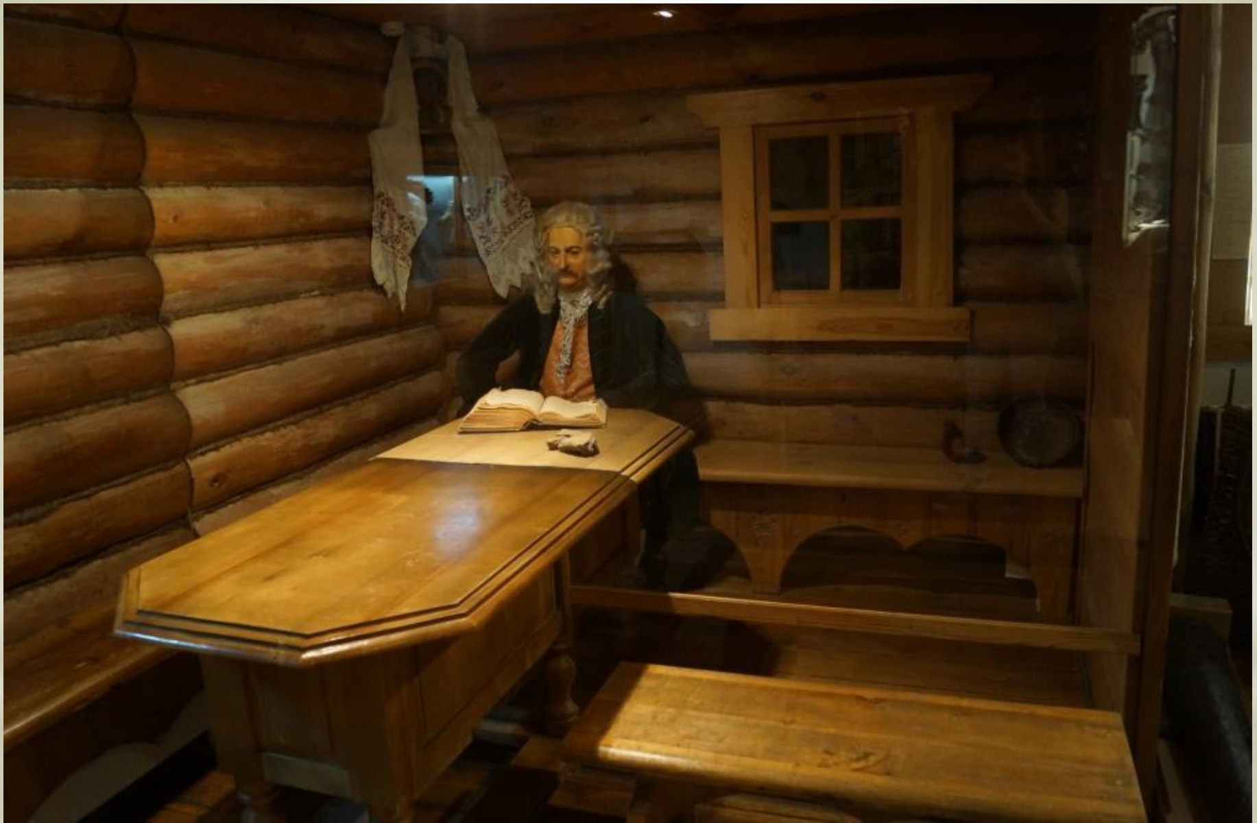
Тульский оружейник Демидов, основатель металлургических и оружейных заводов в Туле и на Урале