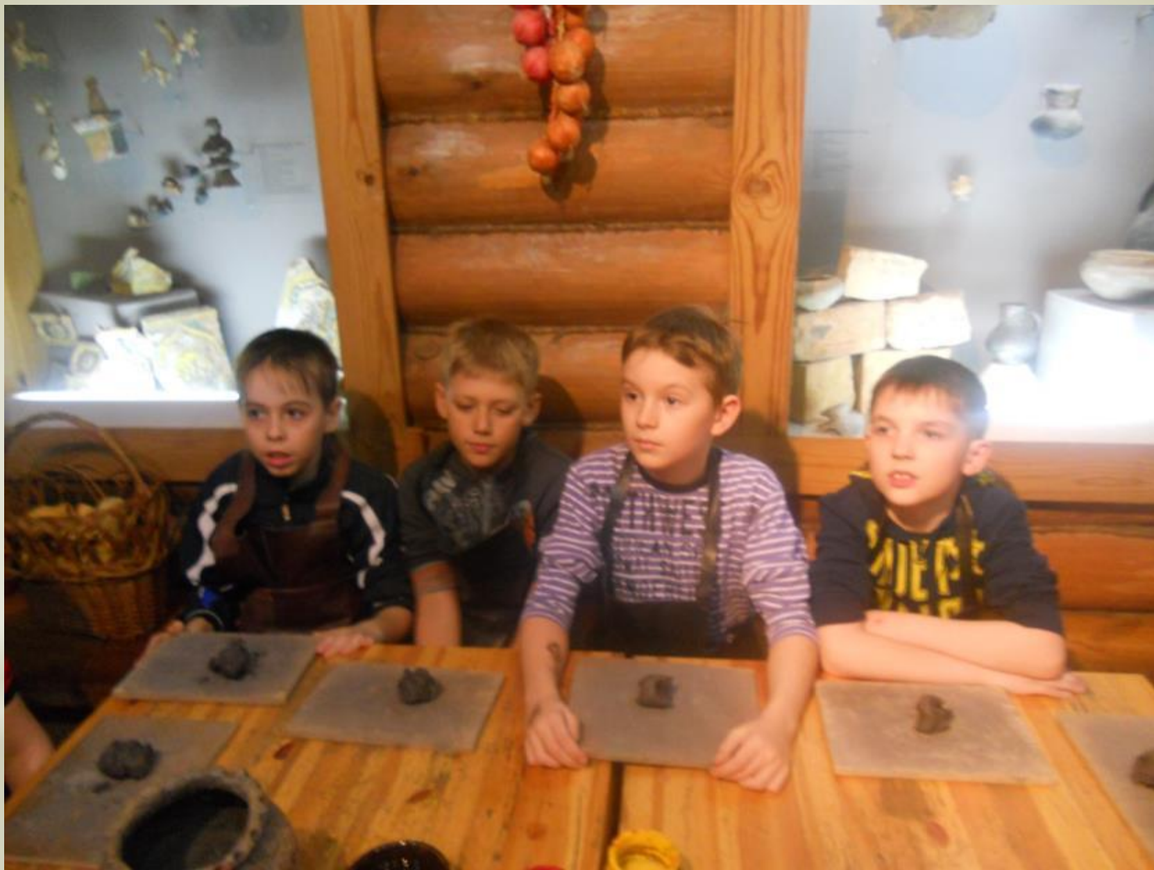
Урок гончарного мастерства