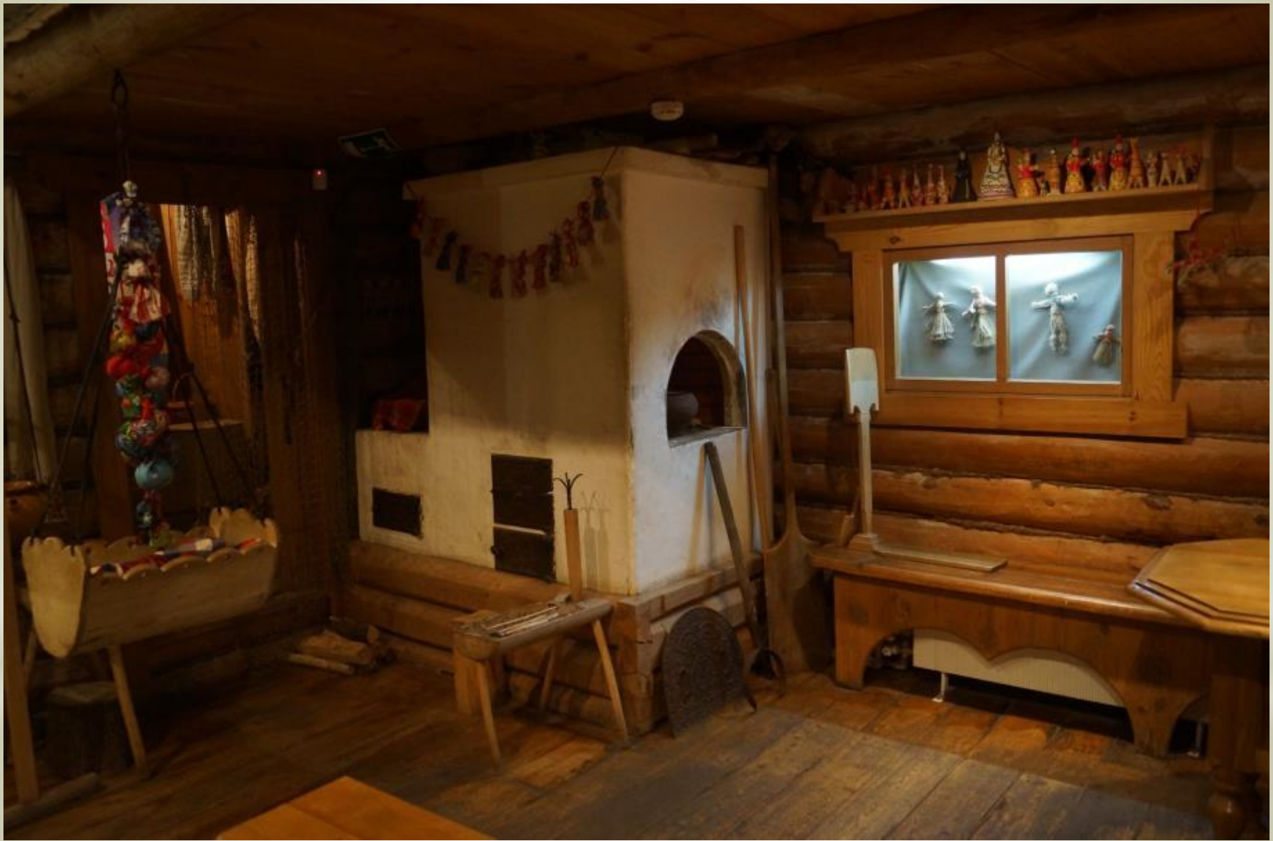
Интерьер русской избы