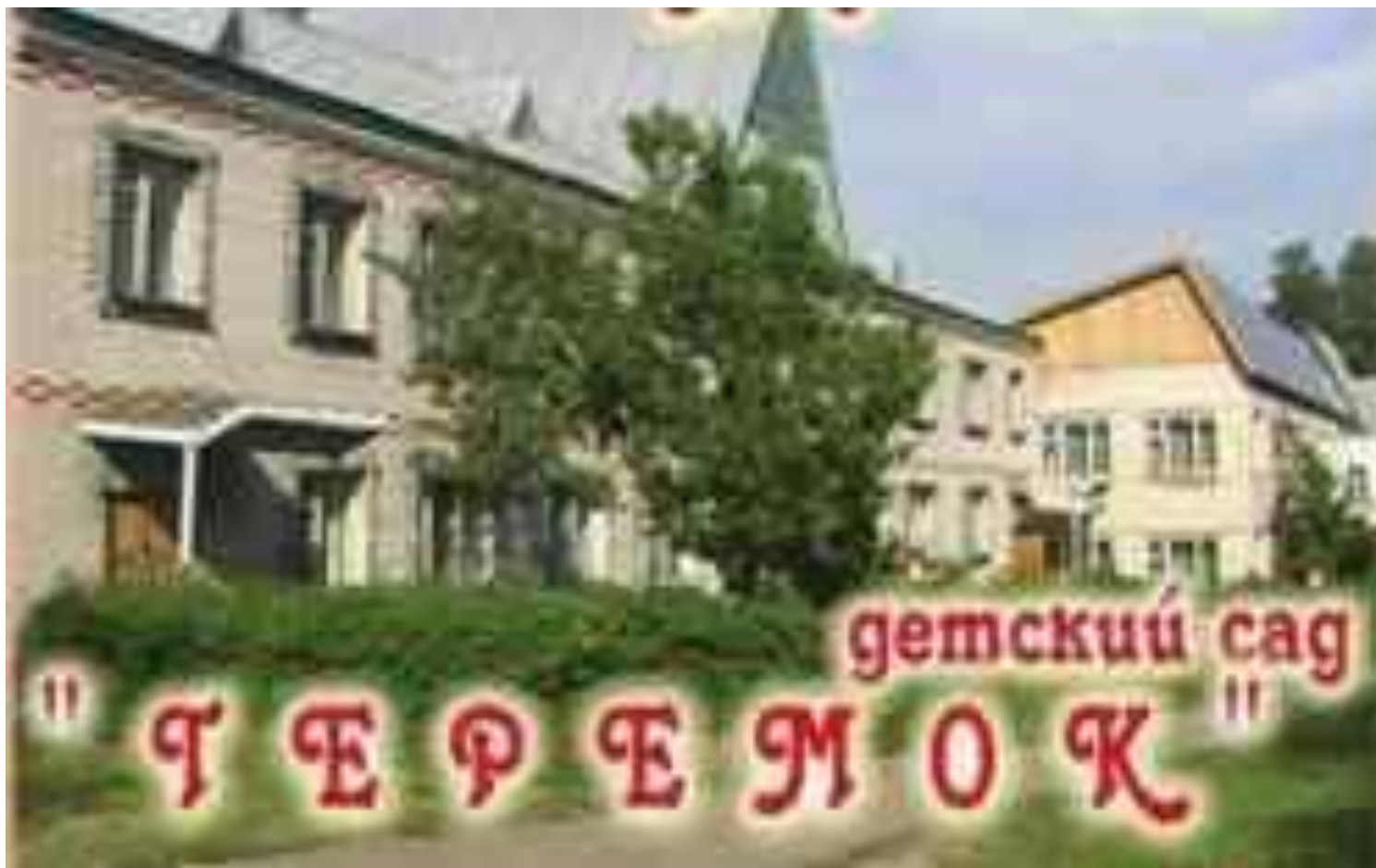
Муниципальное дошкольное образовательное учреждение «Детский сад №3 «ТЕРЕМОК» комбинированного вида» поселка Красная Горбатка