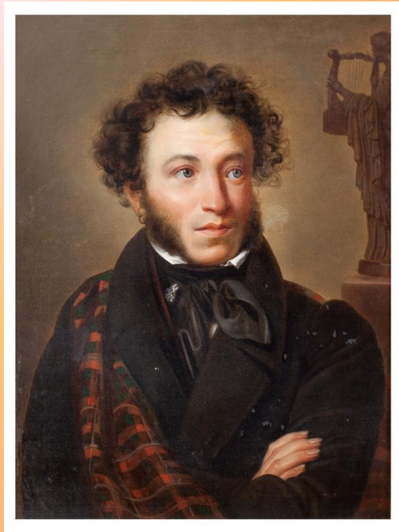
Александр Сергеевич Пушкин 1799-1837