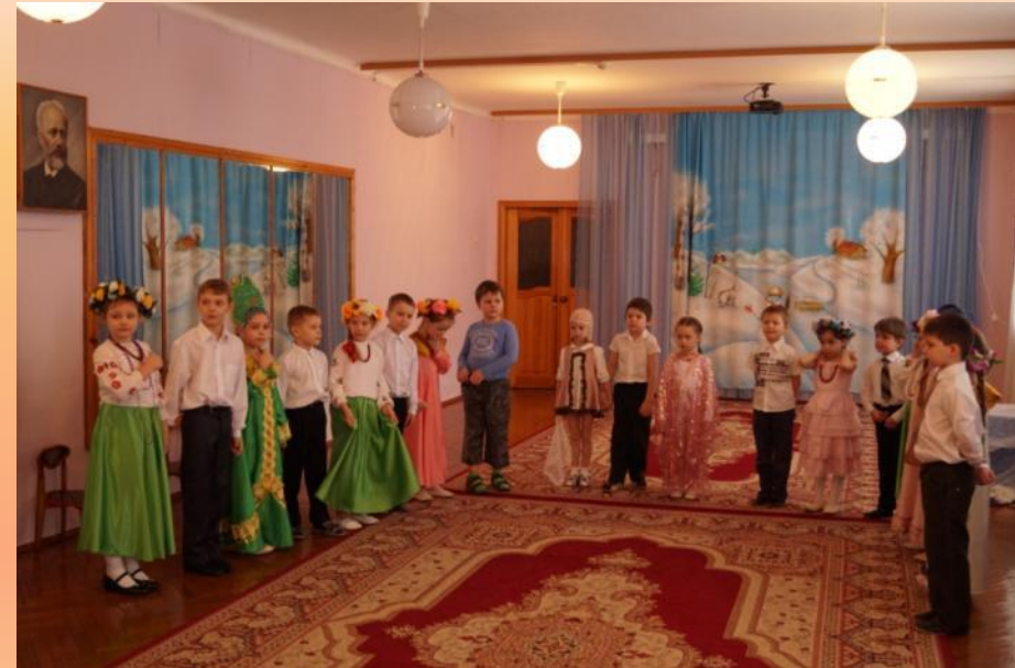
Дети подготовительной группы- участники музыкально-поэтического развлечения по сказкам А. С. Пушкина