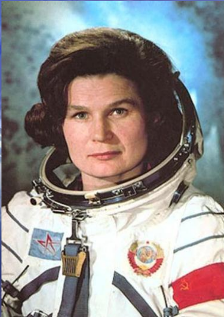
Первая женщина- космонавт Валентина Терешкова