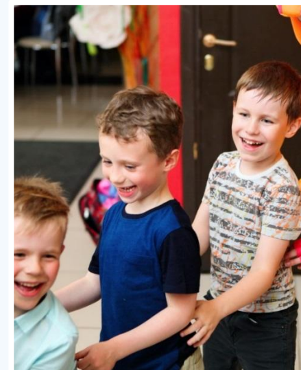
Вытянуть не можем