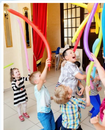
Вместе – мы сила