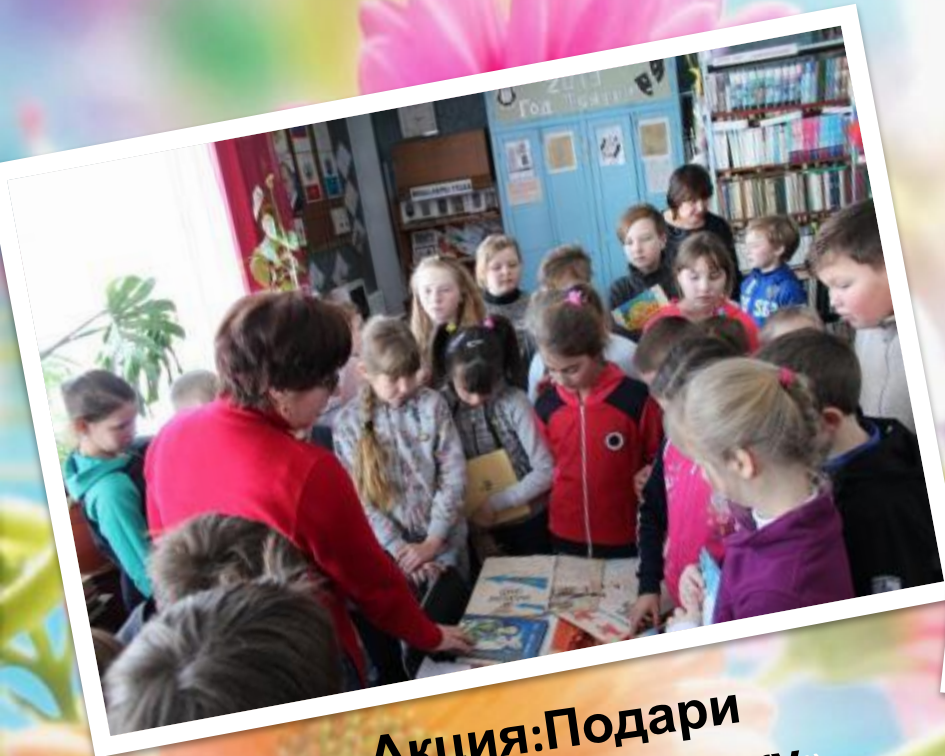
Акция: Подари библиотеке книжку»