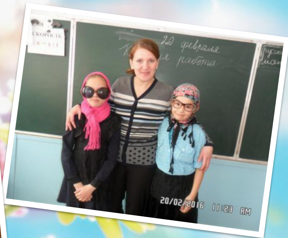
Праздник 23 февраля