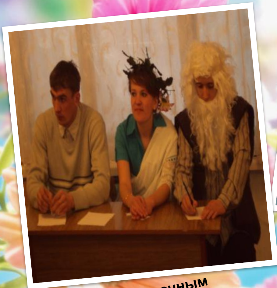
«По сказочным страницам»