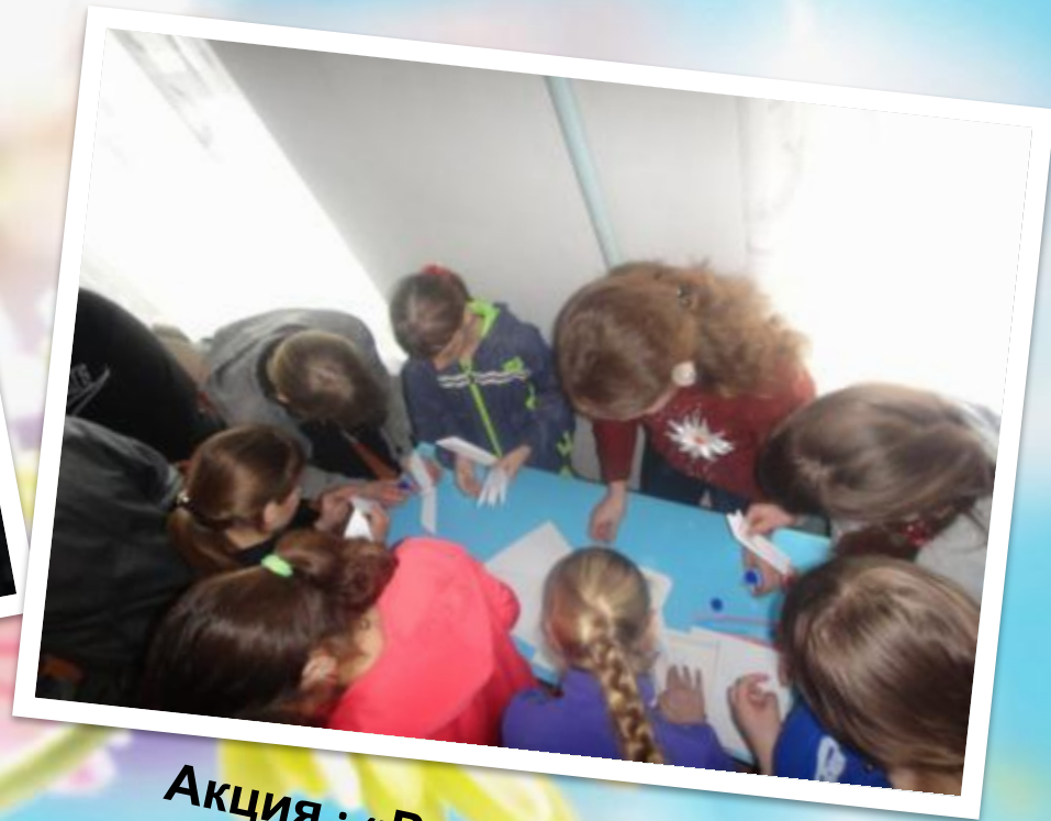
Акция : «Ромашка против туберкулеза»