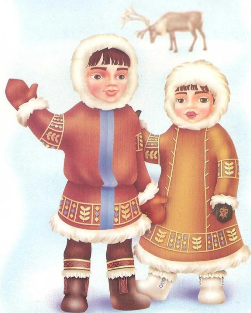
Умкэ и Пичик