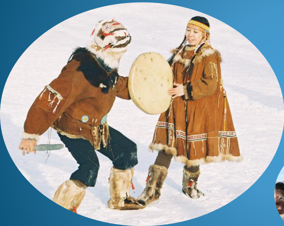
Танец с бубном