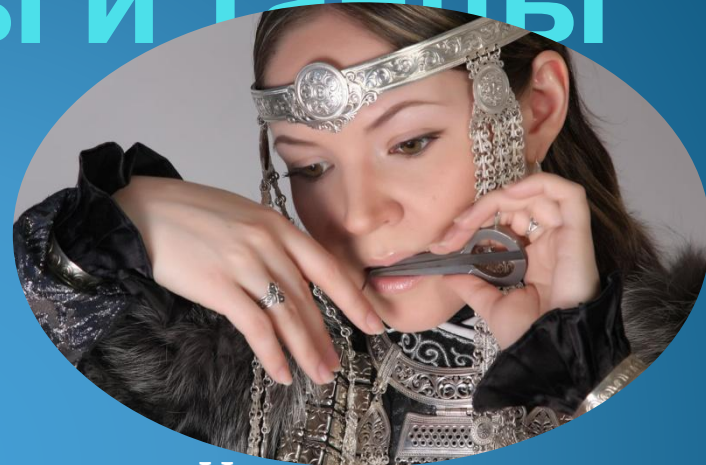
Игра на варгане