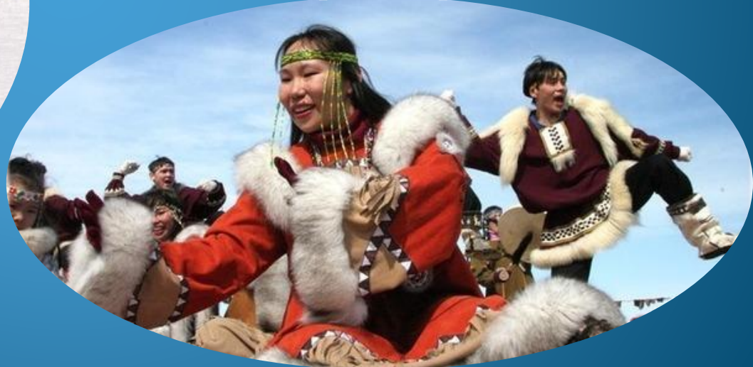
Танцы чукчей носят обрядовый характер