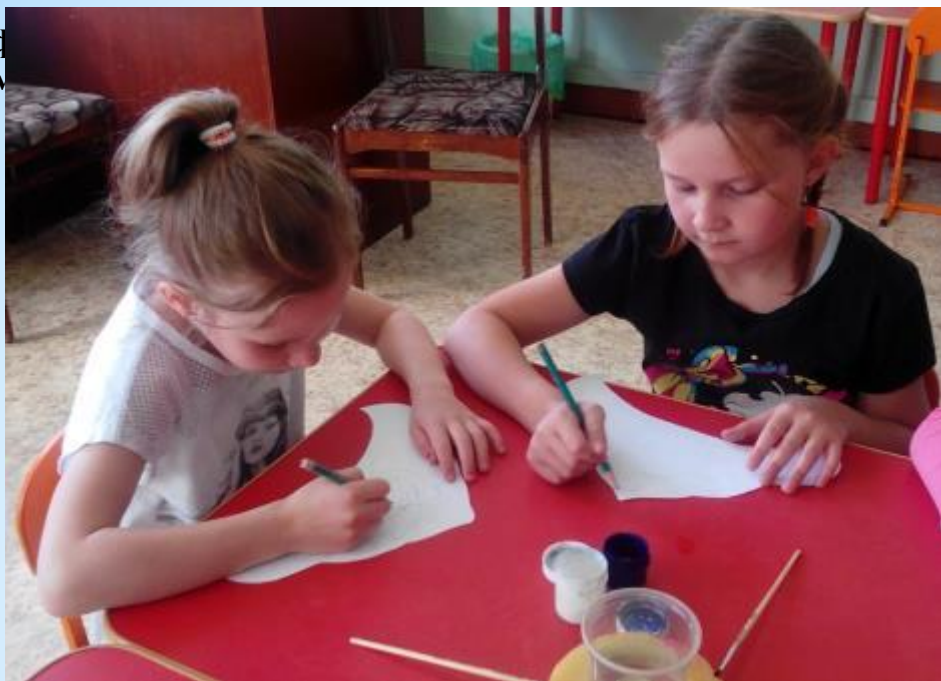
Рисование: Кокошник для царевны