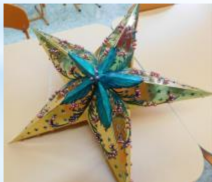
Оформление Новогодней звезды (хохлома)