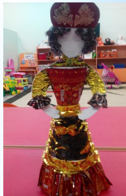
Ручной труд «Кукла из фантиков» (хохлома)