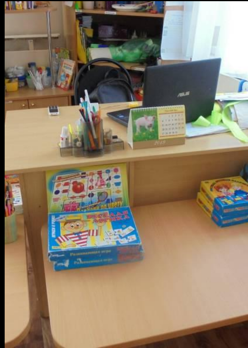
1.7. Рабочий сектор (ИКТ для педагога)