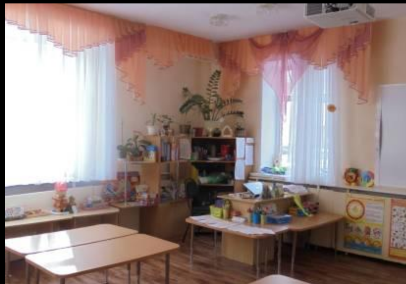
Нижняя правая точка