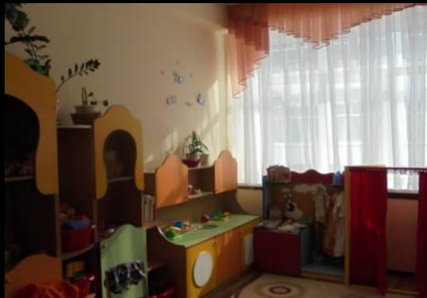
Верхняя правая точка