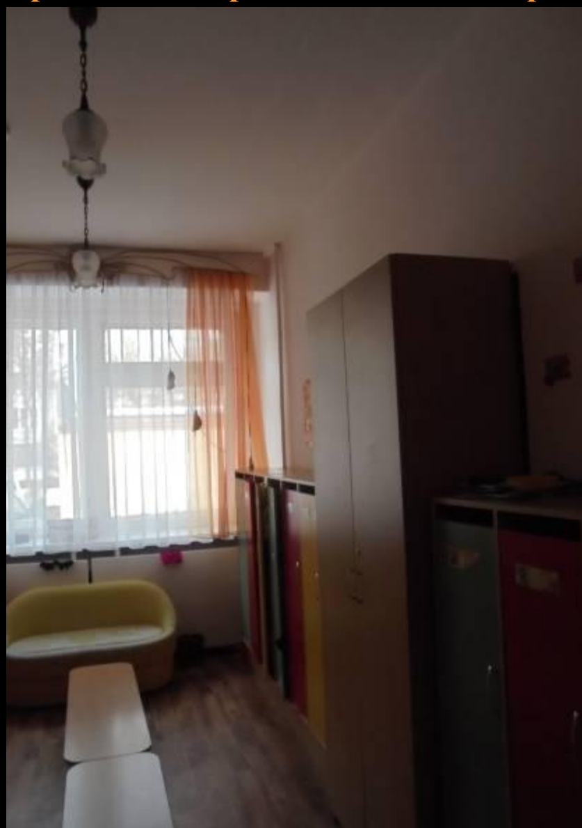
Среда для диалога с родителями