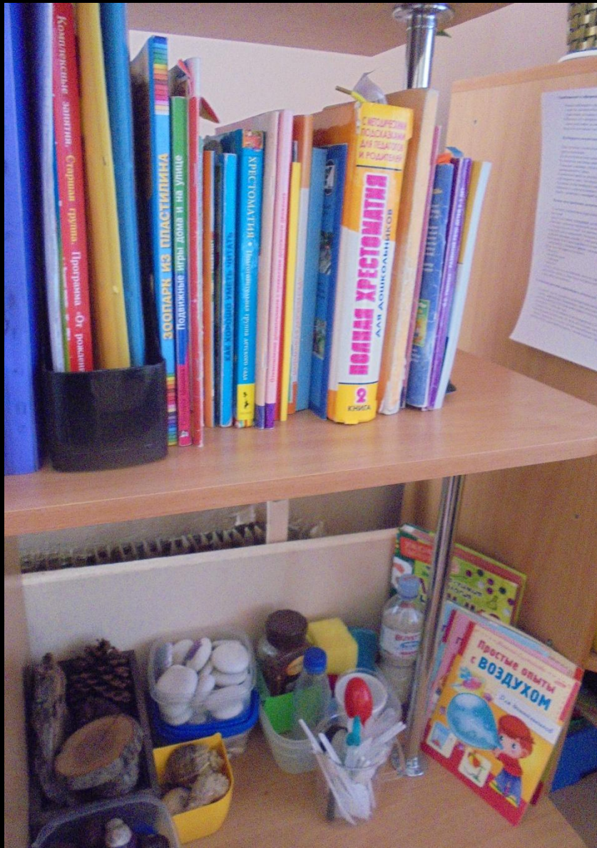
1.6. Рабочий сектор (методическая литература педагога)