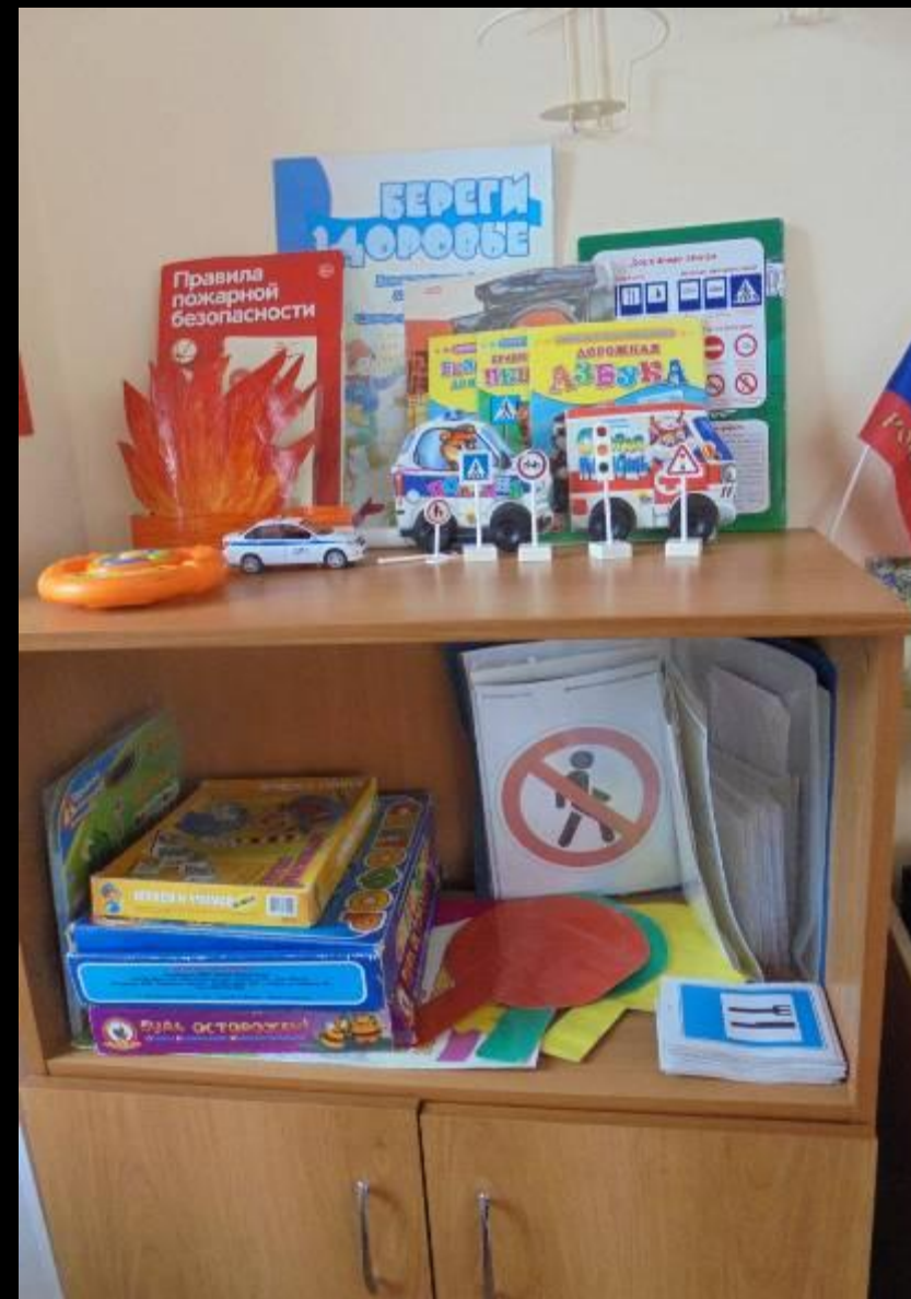
2.2.5. Активный сектор