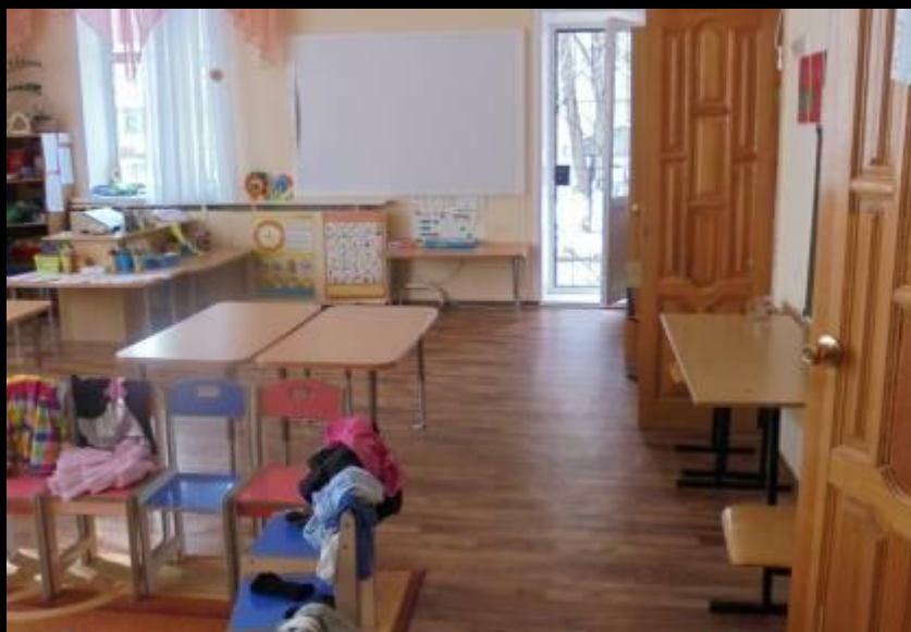
Вход в группу, нижняя левая точка