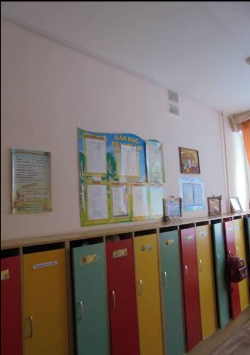
Среда для диалога с родителями