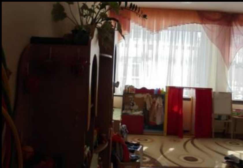
Верхняя левая точка