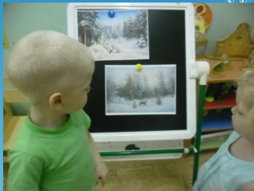
Ёлочка в лесу