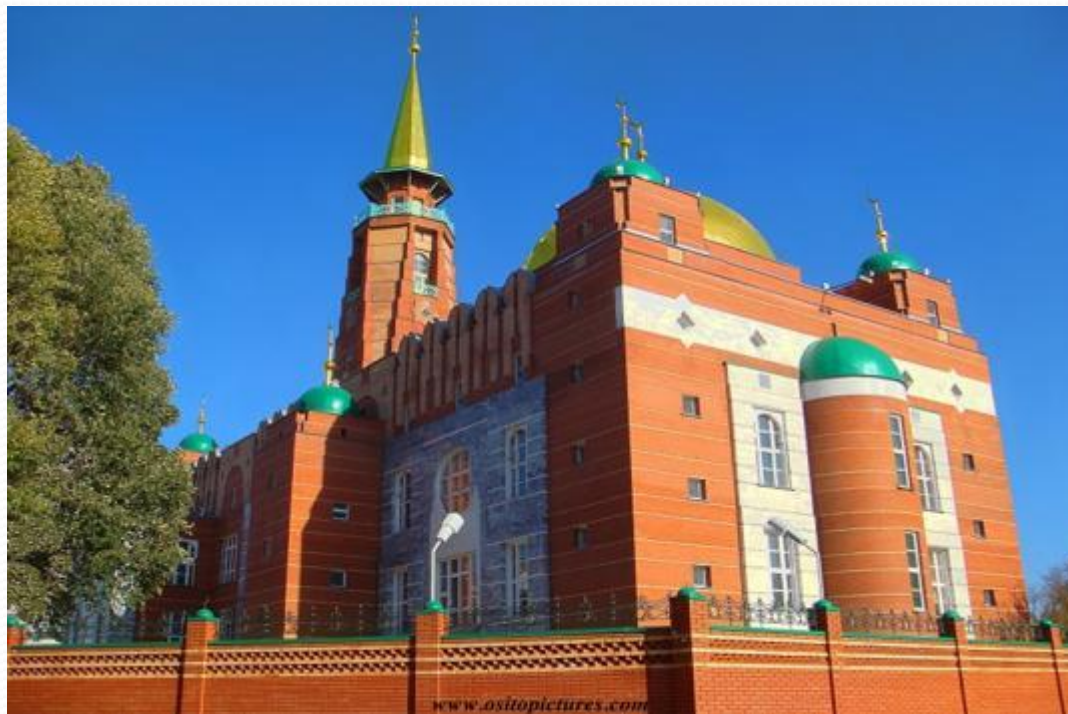
Самарская соборная мечеть