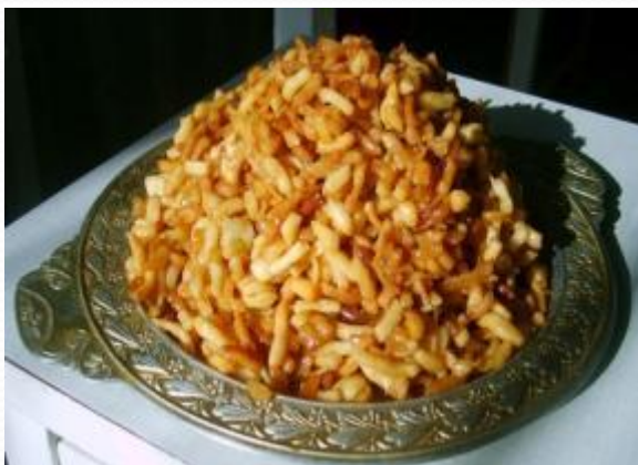
Чак - чак