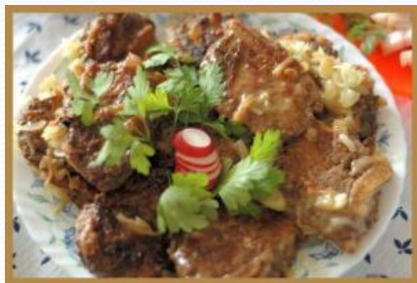
Тувонь сывель максо марто (печень, жареная со свиной)