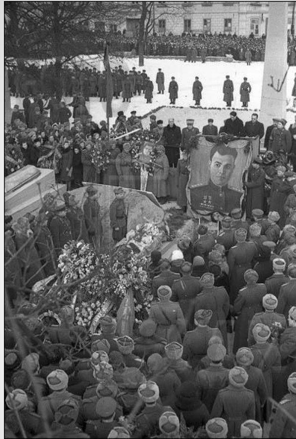
Похороны И. Д. Черняховского