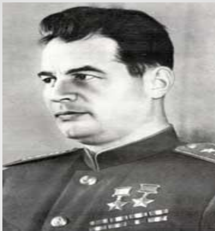
Иван Данилович Черняховский (29 (16) июня 1906 — 18 февраля 1945)