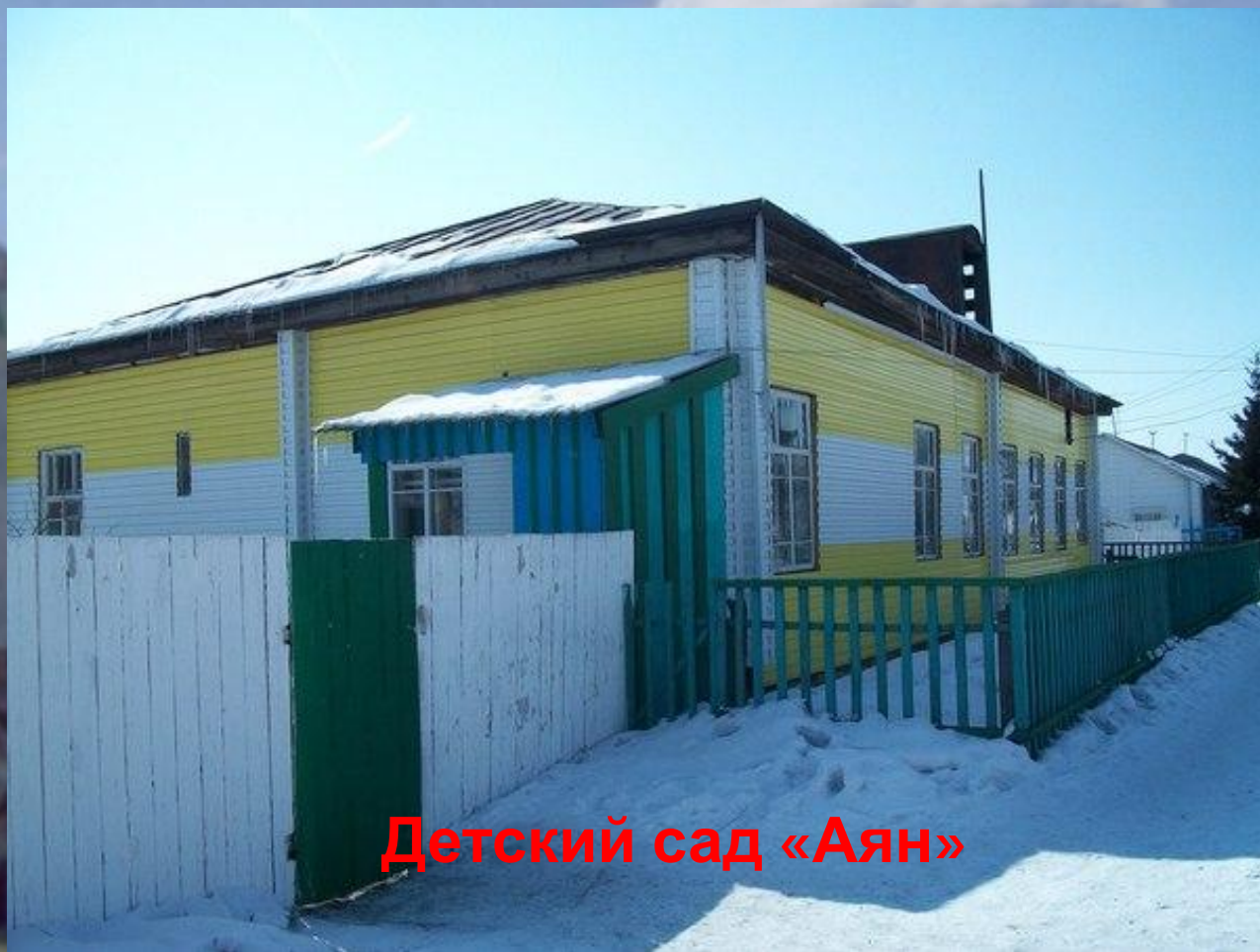
Детский сад «Аян»

Мы выбираем. Нас выбирают. Как это в жизни не совпадает. Только в жизни так совпало, Что неразлучен я с детским садом.