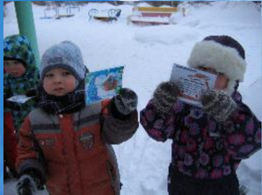
Малышы получили билетіки