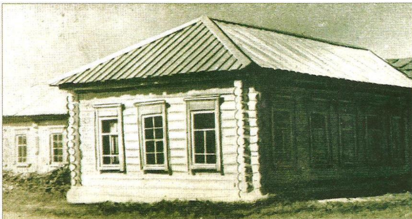
Муса Жәлил укыган Мостафа авылы мәктәбе.