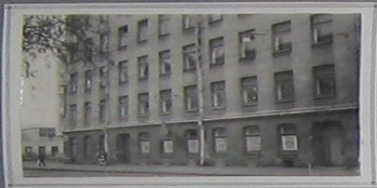
Бывшее здание школы № 105 (пер. Бабурова, д. 5, с 1959 года – ул. Смольничкова, д. 17)