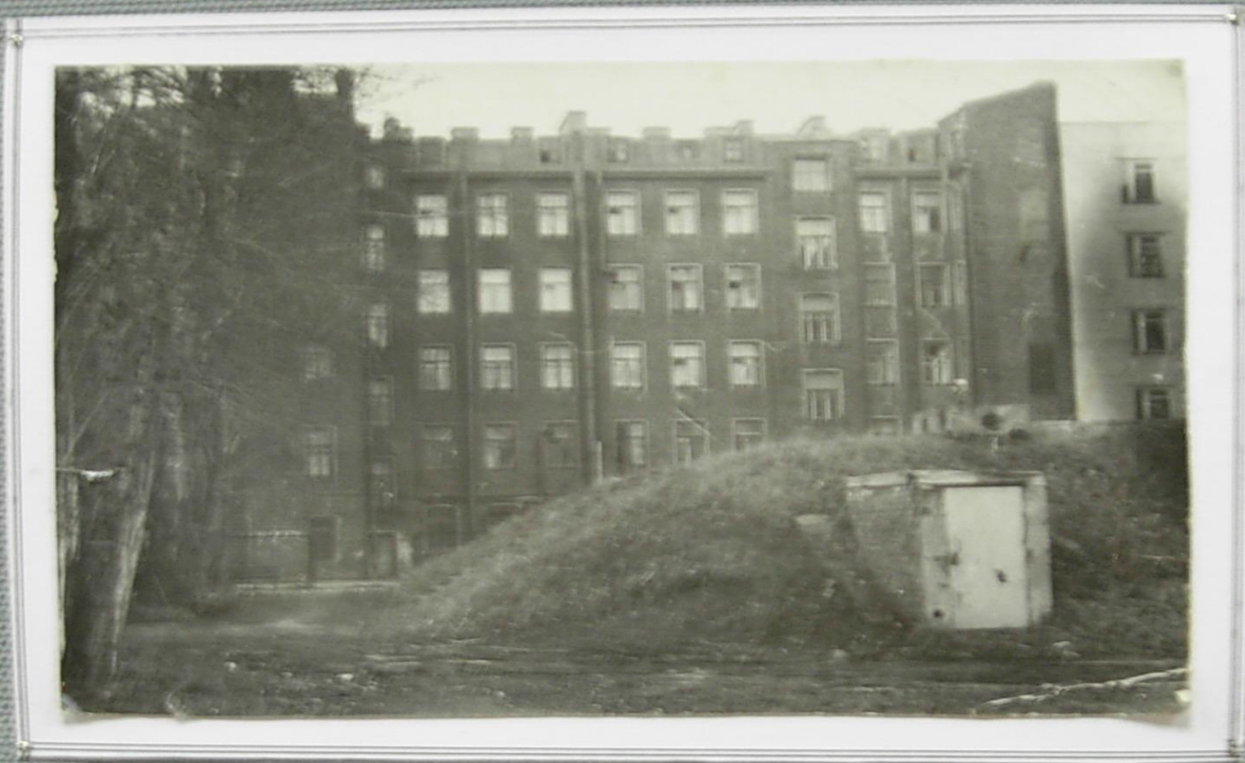
Бомбоубежище школы № 105