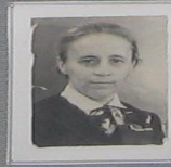
Рабочая А. И. Учитель начальных классов