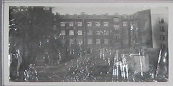
Бомбоубежище школы № 105