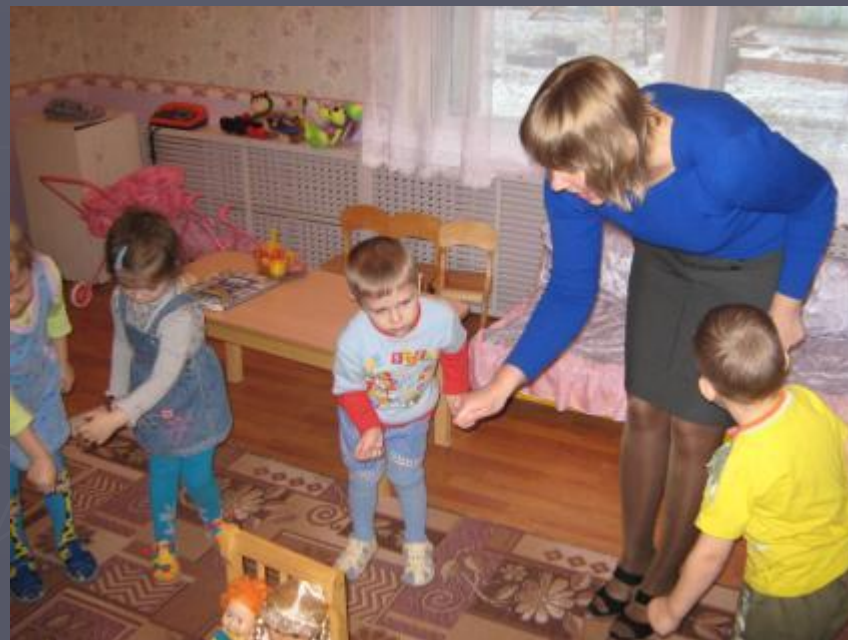
Игровое упражнение "Делаем вот так".